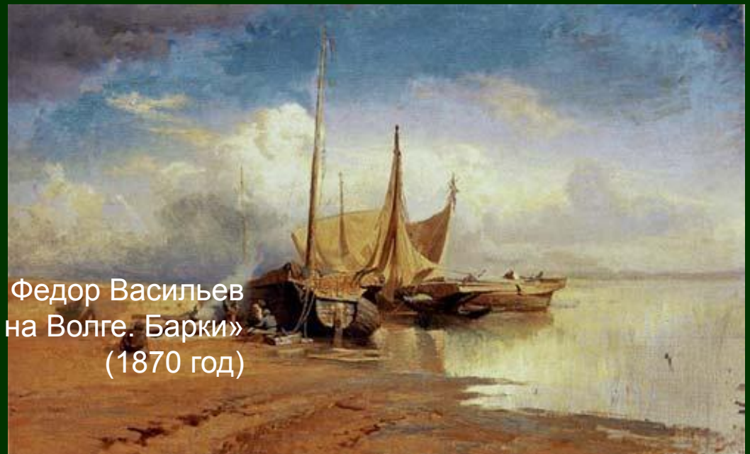
Федор Васильев «Вид на Волге. Барки» (1870 год)