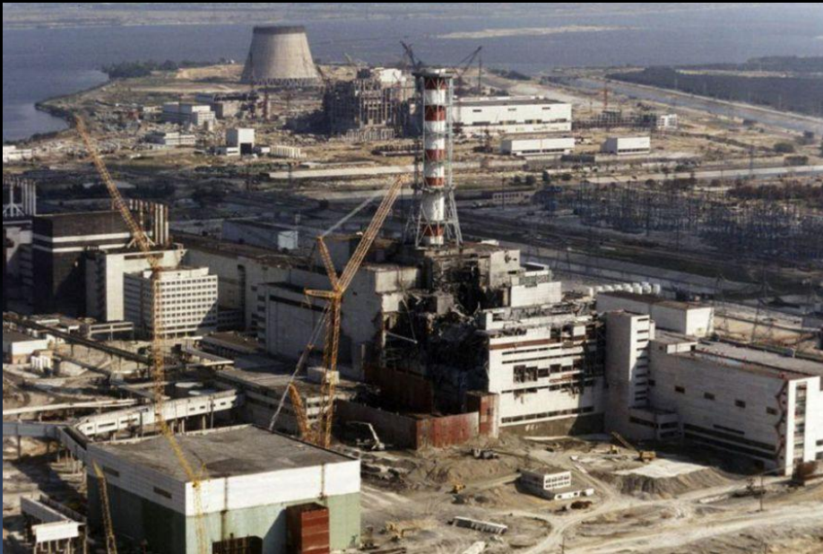
Панорама на 4 энергоблок ЧАЭС после аварии

26 апреля 1986 года произошла авария на чернобыльской АЭС - первой атомной станции Украины, вступившей в строй в 1977 году. Эта самая крупная за всю историю "мирного атома" катастрофа произошла на четвертом энергоблоке АЭС при плановой его остановке: была разрушена активная зона реактора типа РБМК. Так называемая активная стадия аварии продолжалась 10 суток. Все это время происходили чрезвычайно интенсивные выбросы радиоактивных элементов. Ядерное топливо, выброшенное при взрыве, имело очень высокое обогащение урана-235: до 60 процентов и выше.