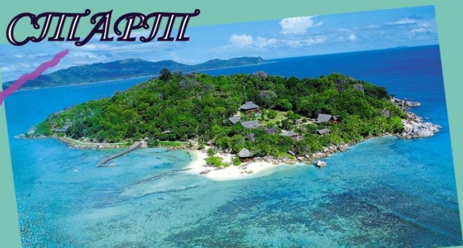
остров геометрических фигур