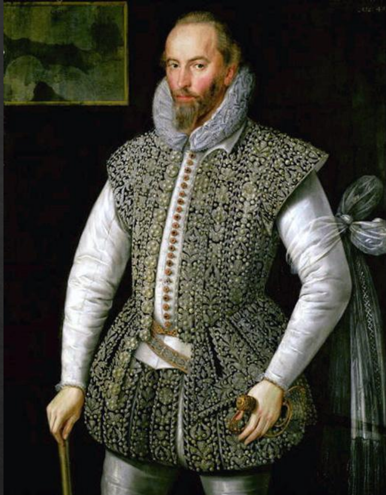
Sir Walter Raleigh. Unknown artist. National Portrait Gallery of Ireland, Dublin.

Штаны-буфы-шили из тканей ярких цветов, украшали вышивкой, бордюром, драгоценными камнями, а с конца века — кружевами. Колет по форме напоминал испано-французский: имел узкие рукава, крылышки у плеч и стоячий воротник.