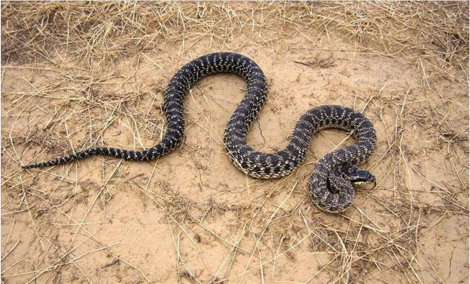
Сарматский полоз. Полоз сарматский четырехполосный - редкое краснокнижное животное Крыма.