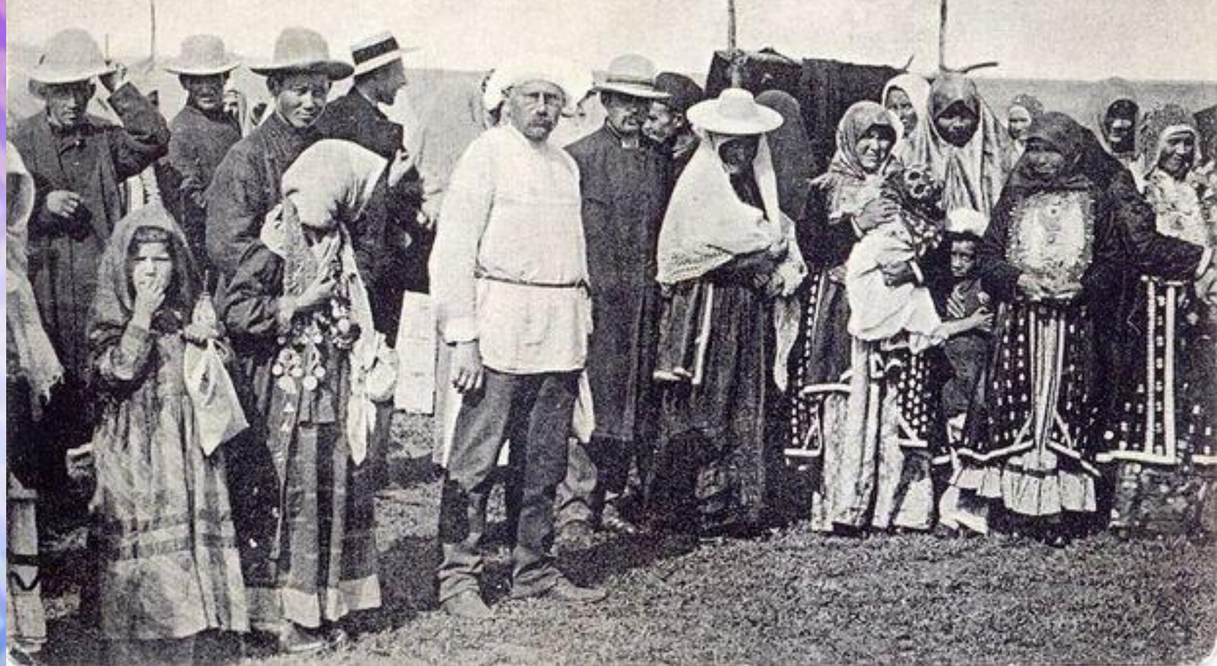
Башкиры съ женами (бабами) и дѣтьми, рядомъ кумысинки на праздникъ „Зиннѣ“ при дер. Ебалакльы