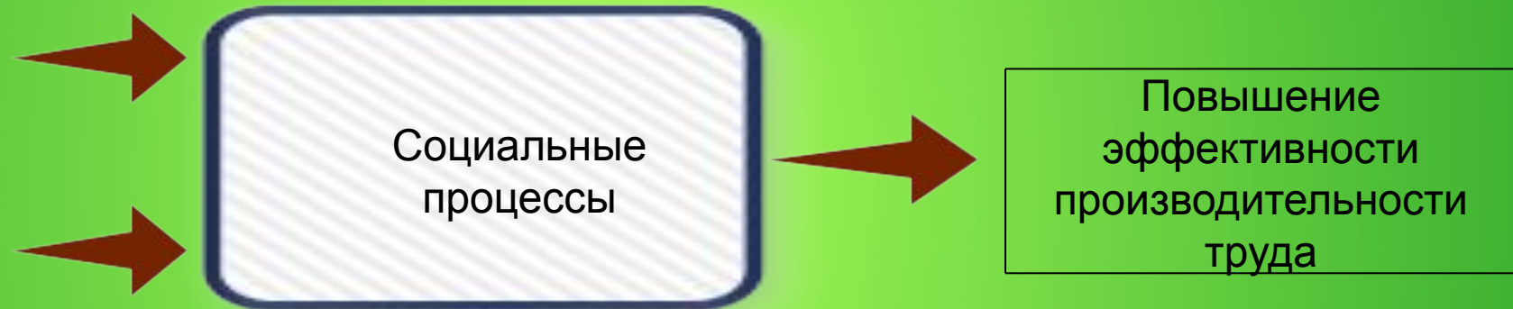
Схема модели «Социальный подиум»