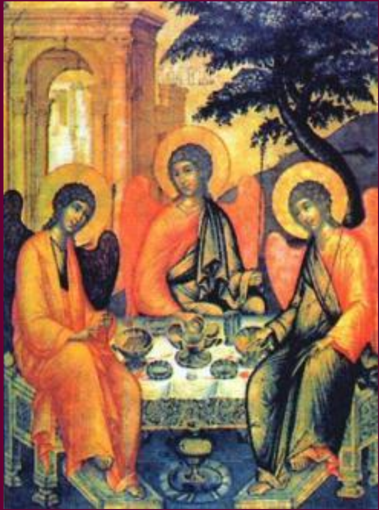
Симон Ушаков. «Троица»

Основным видом живописи продолжала оставаться иконопись .