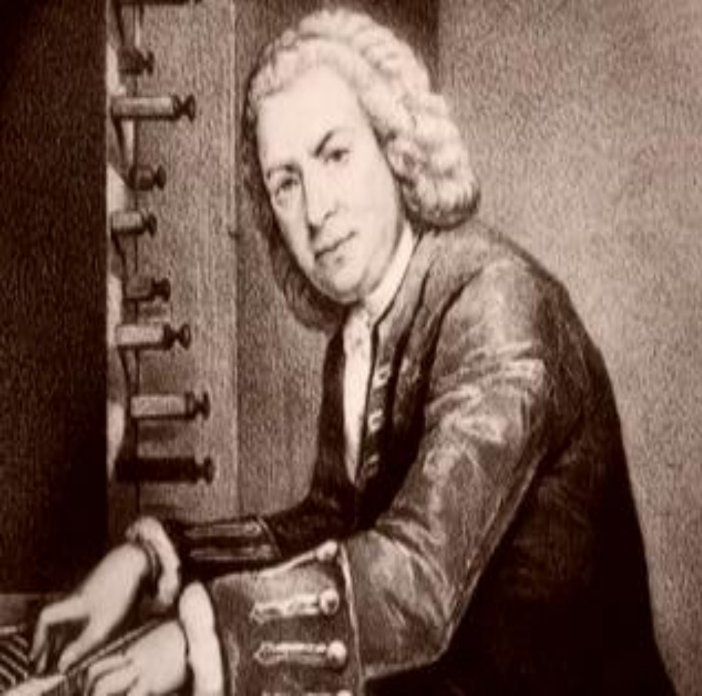
Thüringen ist der Geburtsort von Johann Sebastian Bach.