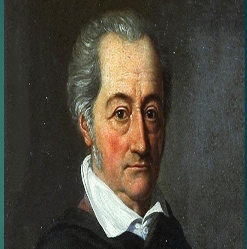
Johann Wolfgang von Goethe