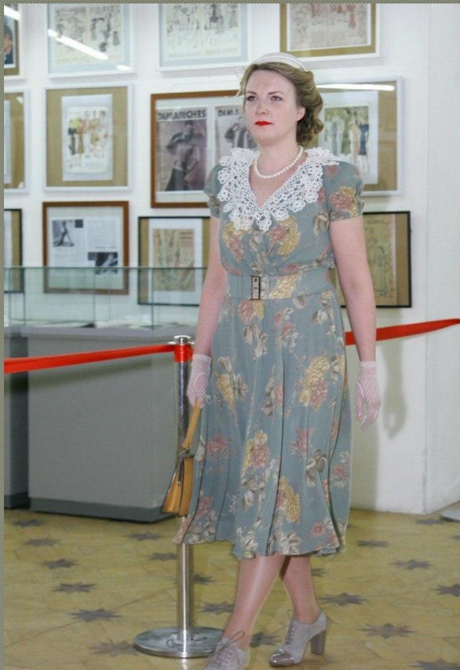
Реконструкция "Показ мод 1945 года". 10 марта 2013 года. Санкт-Петербург.