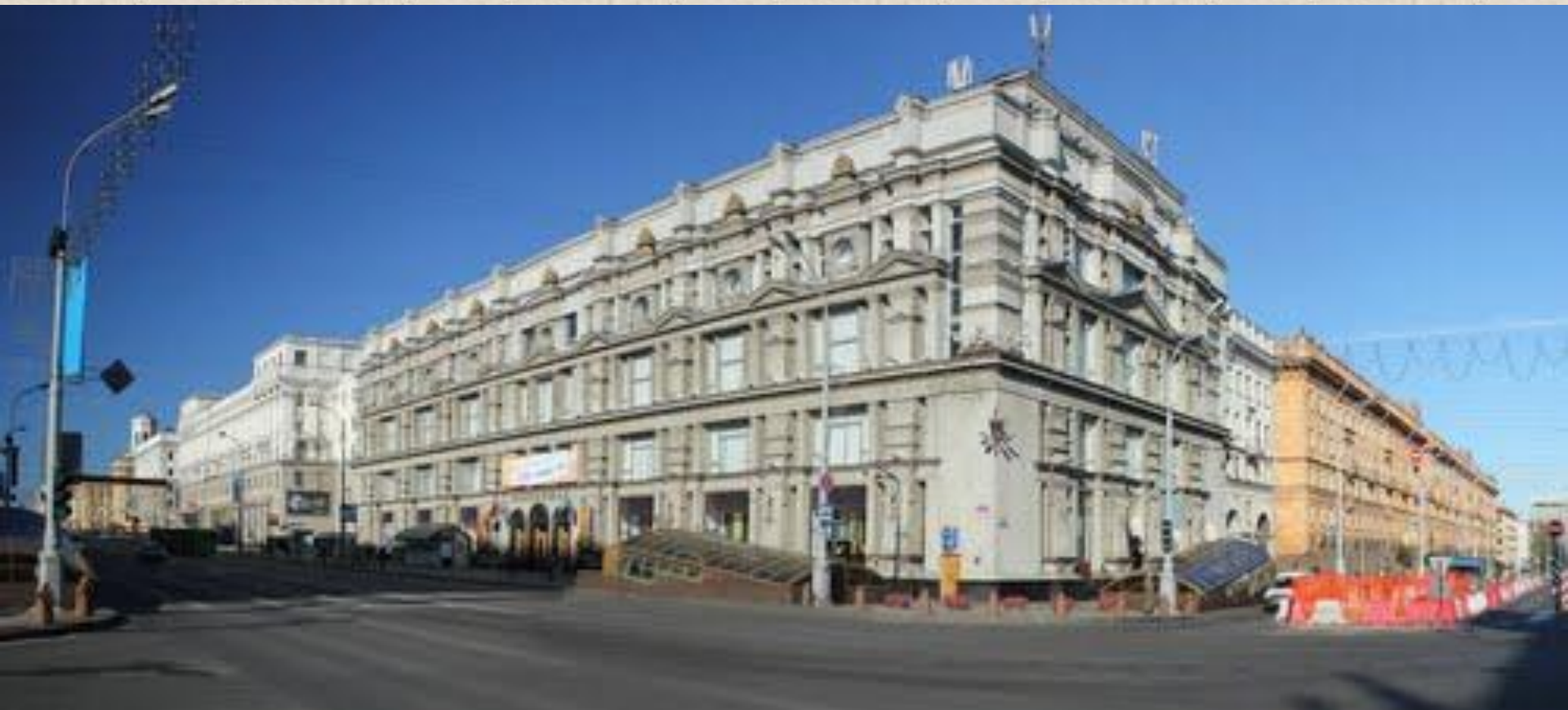
Здание ГУМа (1952 г.)