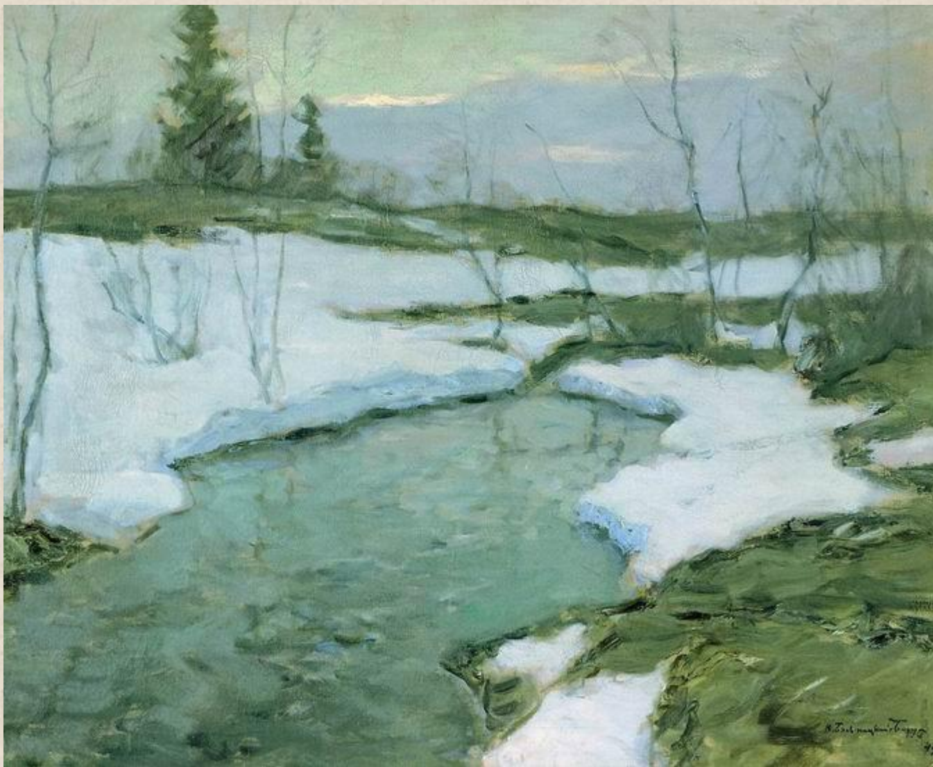
Вітольд Бялыніцкі-Біруля (1872-1957)