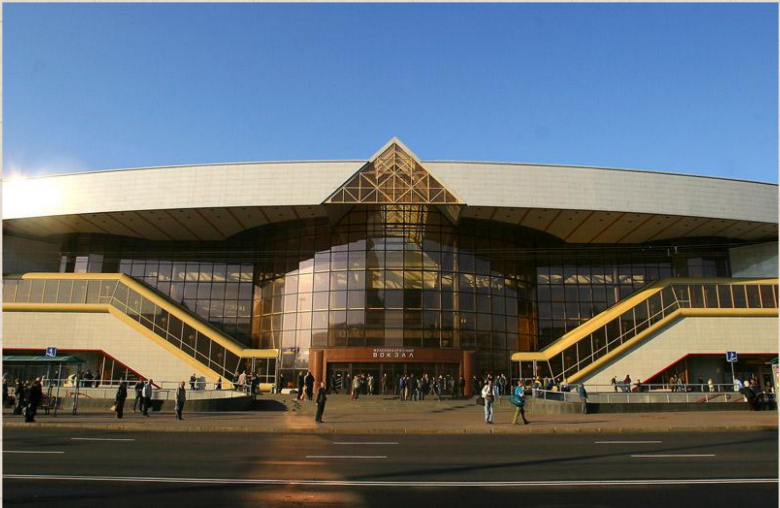
Новый железнодорожный вокзал в Минске В. Крамаренко