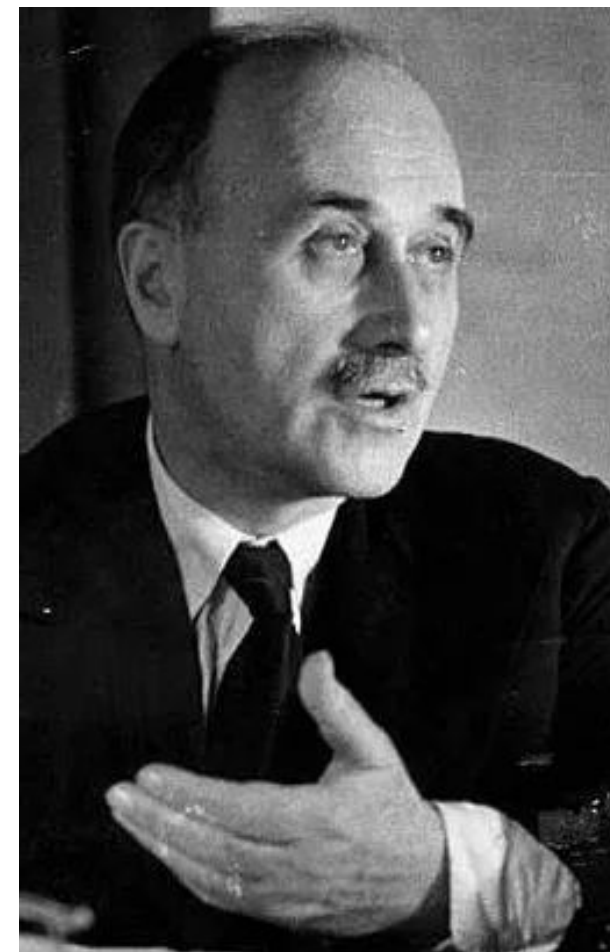
Робер Шуман, Конрад Аденауэр и Жан Монне