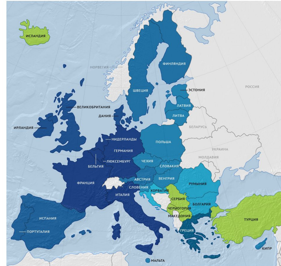
Хронология вступления государств в ЕС