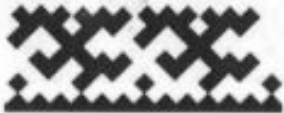
двойная березовая ветвь