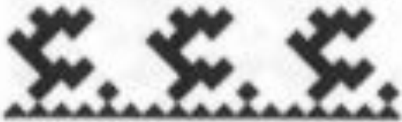
узор с березовой ветвью