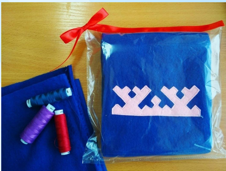
Орнамент «Заячы ушки»

Орнаменты возникли в лесной зоне, потому что именно там большое количество зверей. Они появлялись в результате наблюдений за природой и окружающим миром.