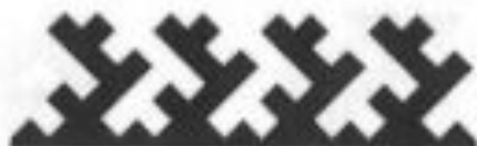
сгиб лапы лисы