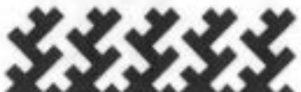
локоть молодого лисенка