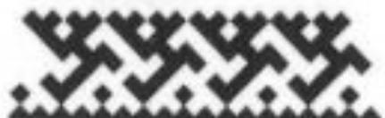
цельный рог оленя-самца