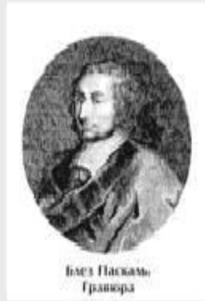
Блез Паскаль Гравюра