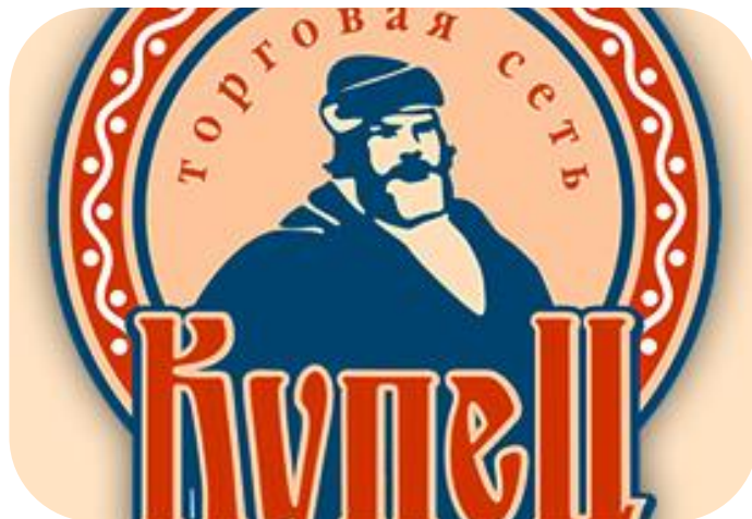
Поддержка конкурентов СПоК