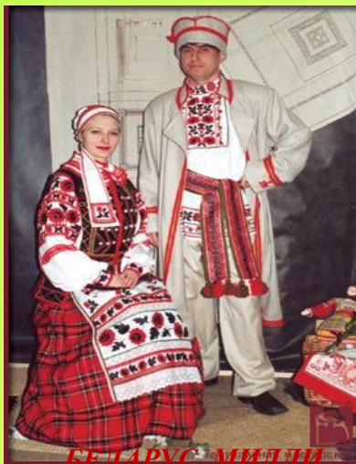
БЕЛАРУС МИЛЛИ КИЕМЕ