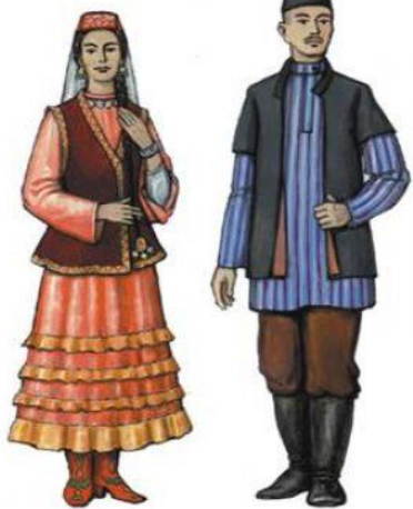
ТАТАР МИЛЛИ КИЕМЕ