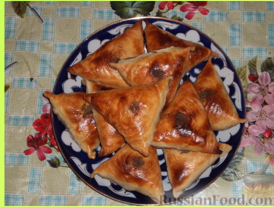
САМСА - ҮЗБӘК МИЛЛИ АШЫ