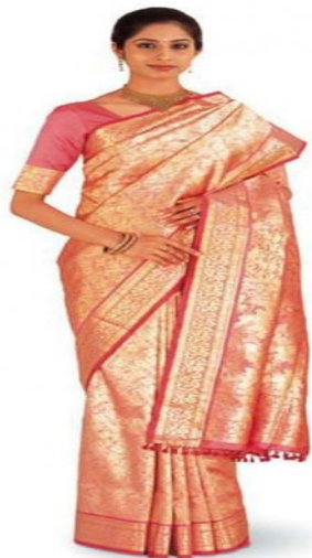
ИНДИЯ МИЛЛИ КИЕМЕ