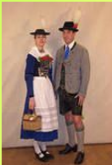
БАВАР МИЛЛИ КИЕМЕ