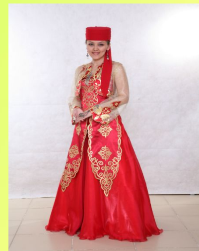
КАЗАК МИЛЛИ КИЕМЕ