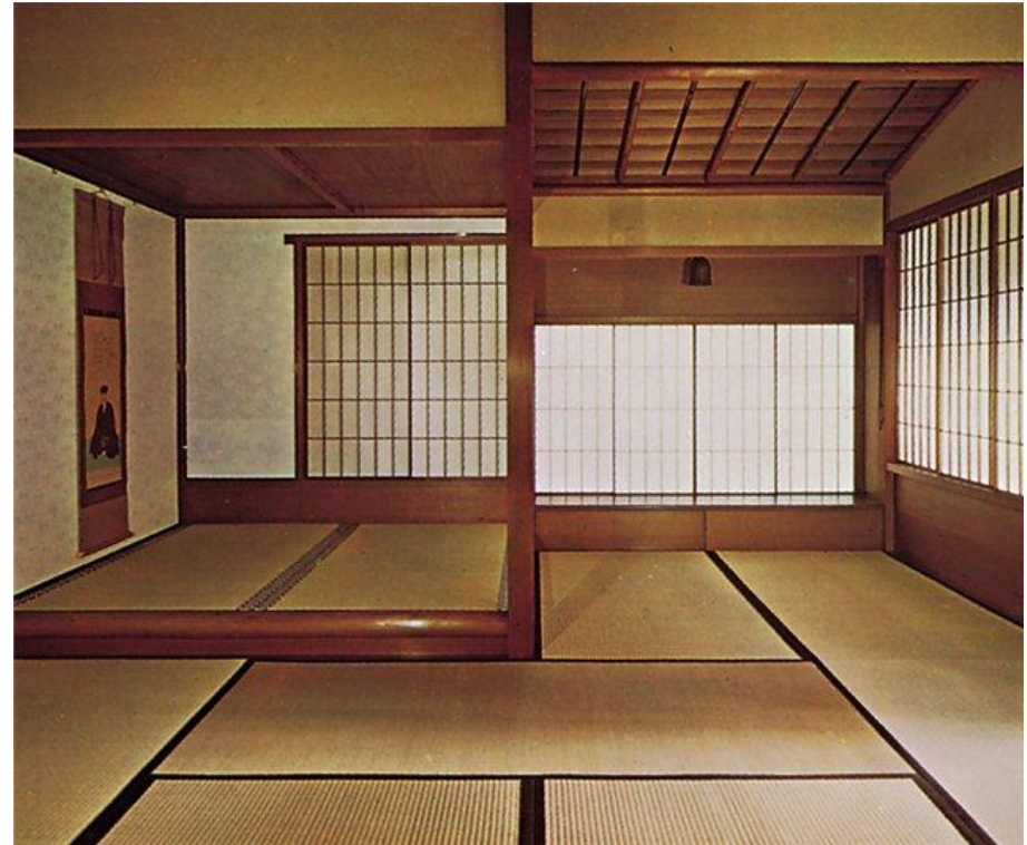
Интерьер в японском стиле. Количество татами на полу определяет размер комнаты.