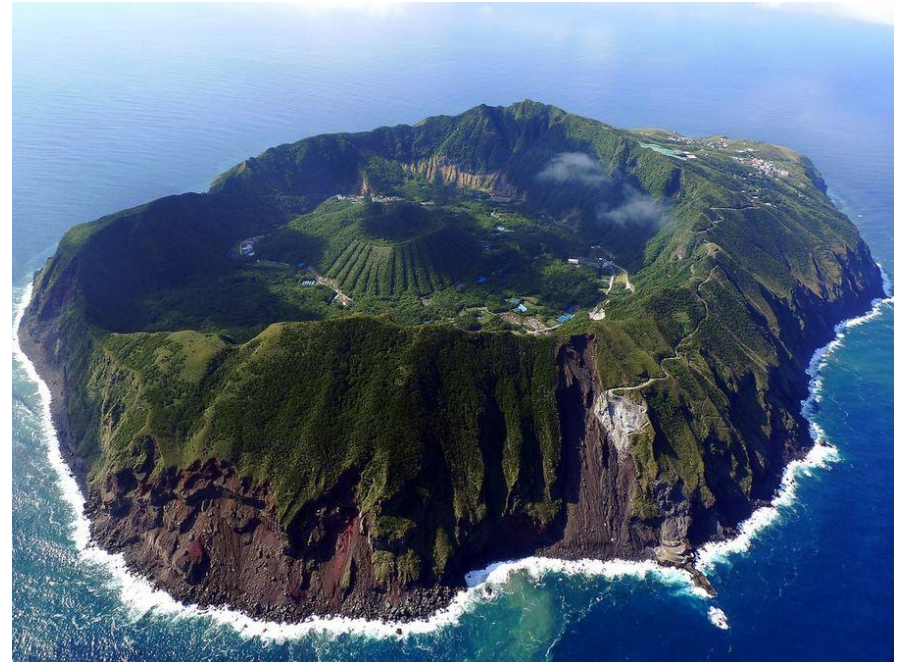
Остров на вулкане Аогашима