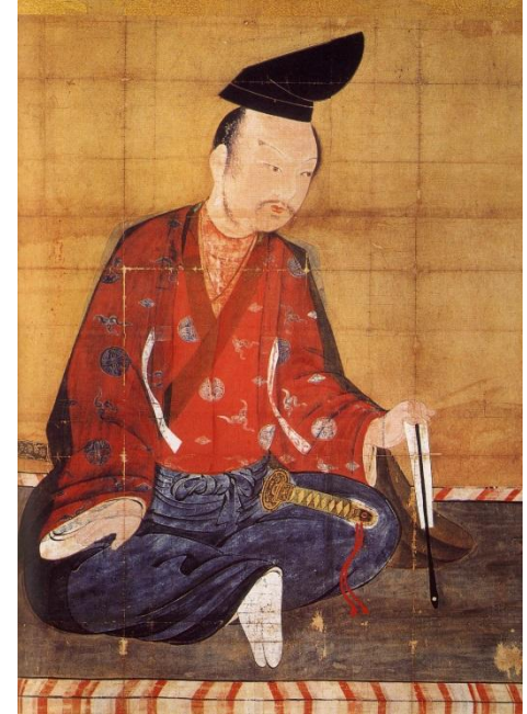
Минамото Куро Ёсицунэ (1159-1189)

Появление «Свода законов». Монголы делают попытки захватить Японию, которые заканчиваются неудачей из-за погодных условий. Конец сёгуната Камакура.