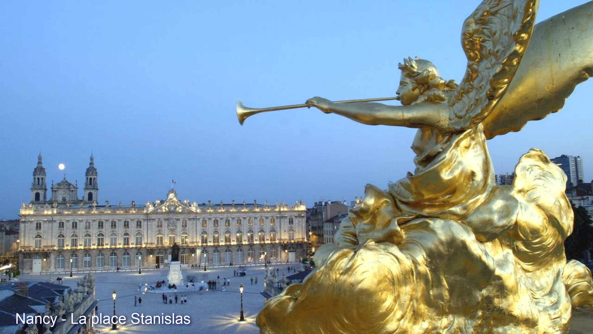
Nancy - La place Stanislas