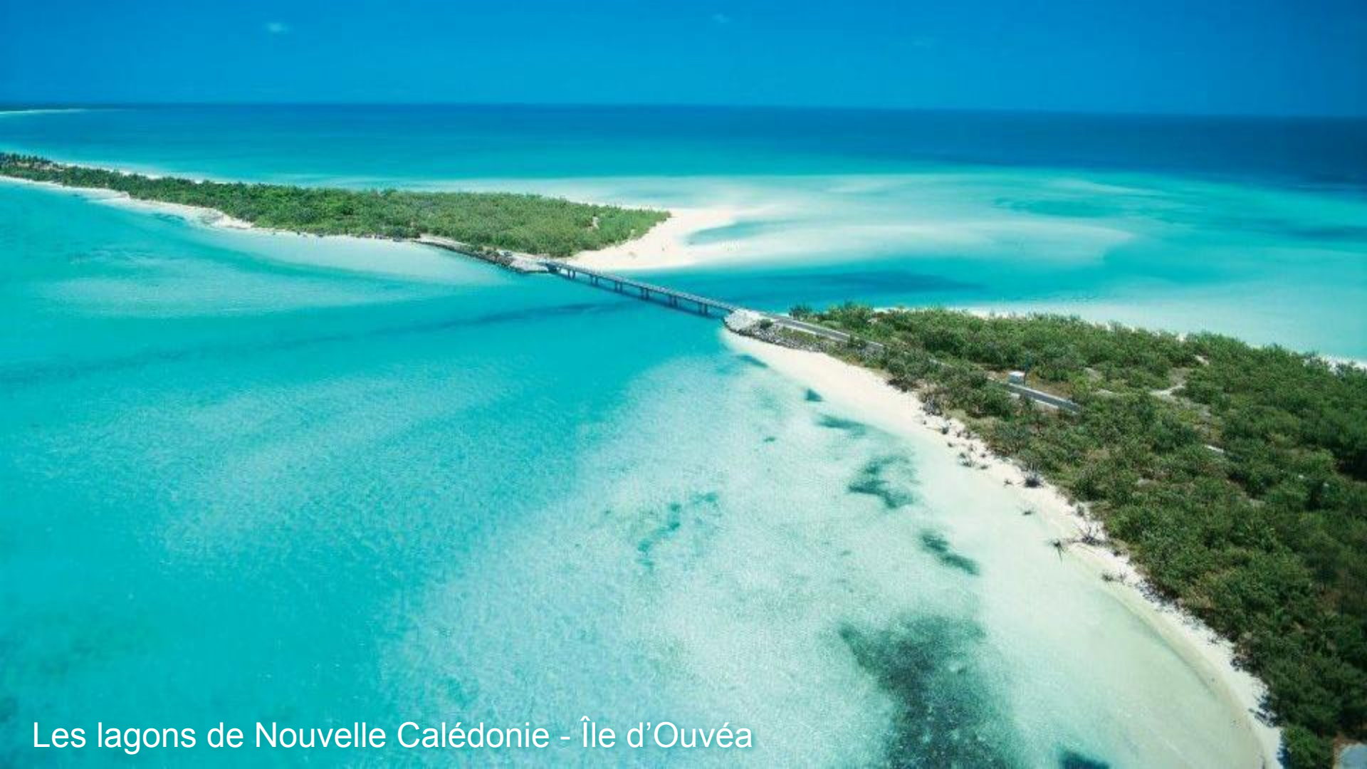
Les lagons de Nouvelle Calédonie - Île d'Ouvéa