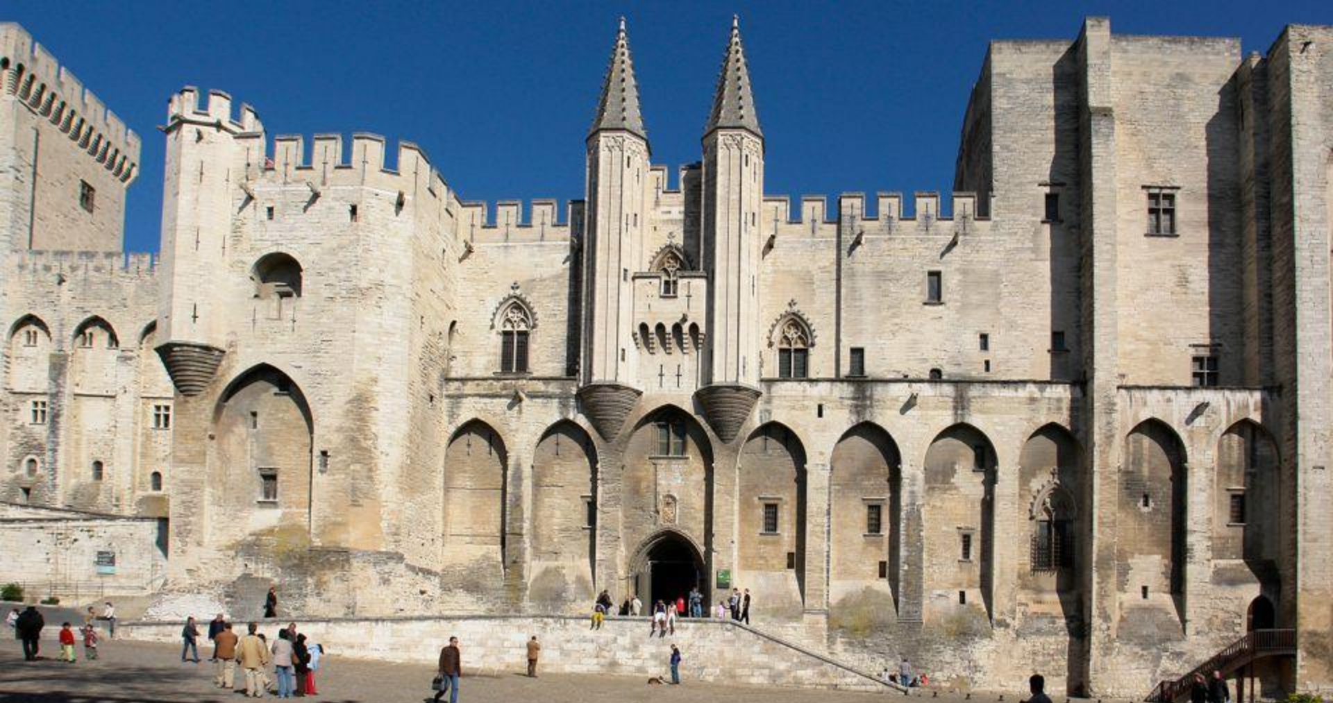
Avignon - Palais des papes