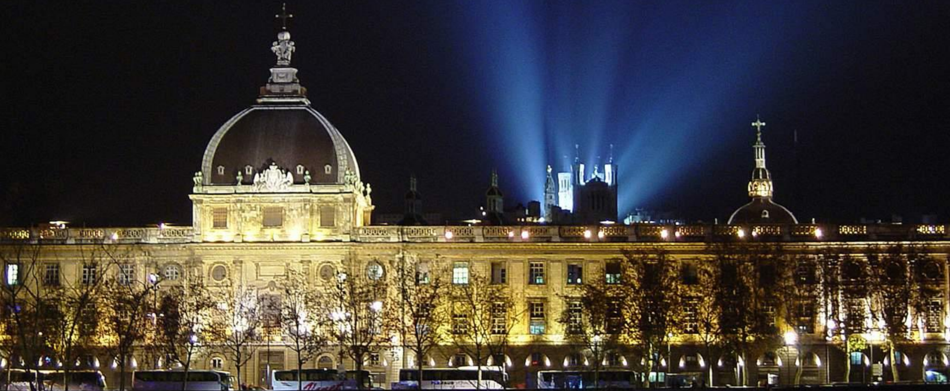
Site historique de Lyon