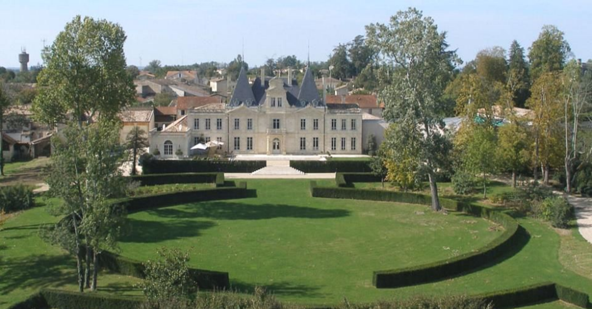
Jurisdiction de Saint-Émilion - Château de Lussac