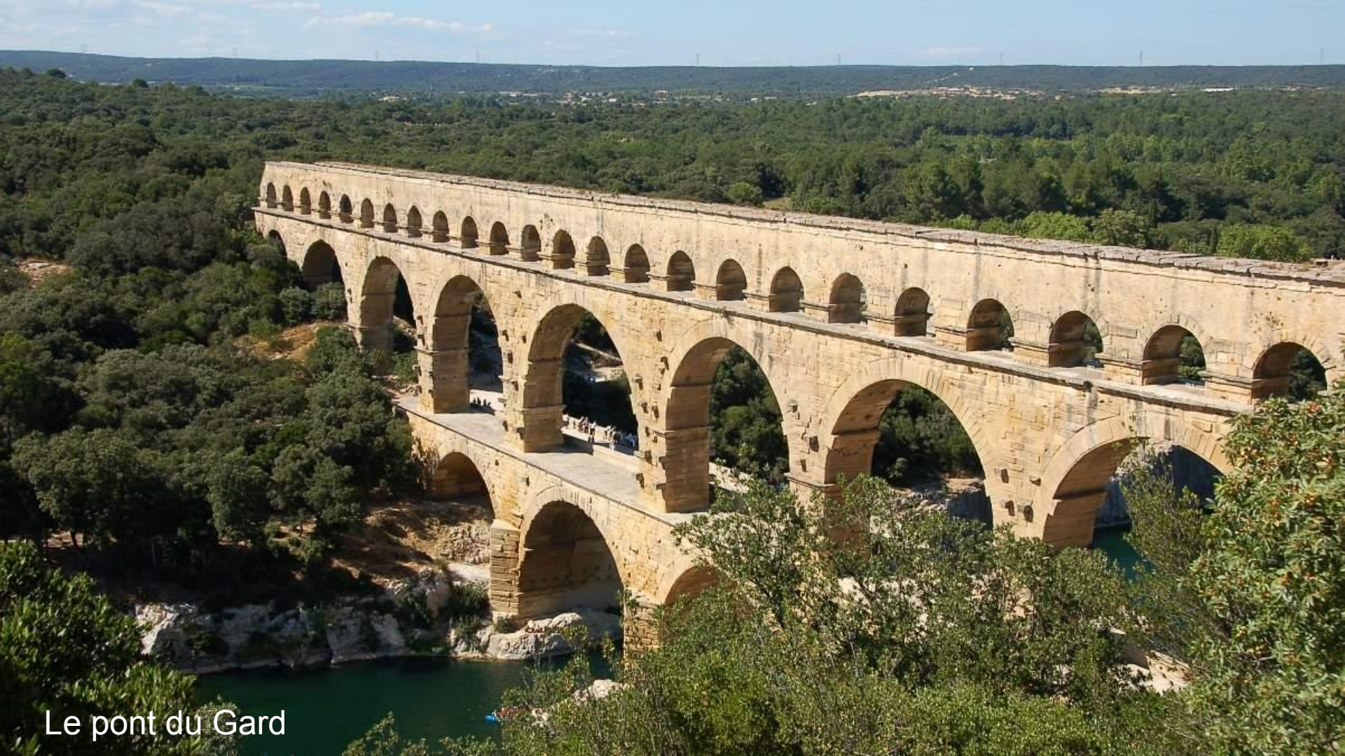
Le pont du Gard