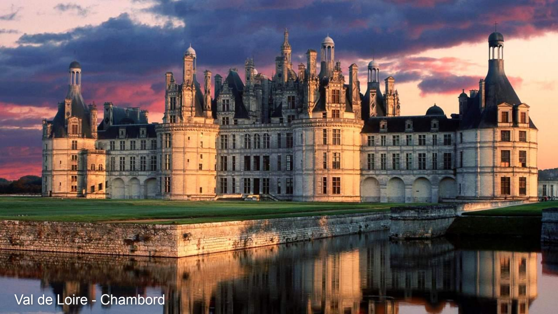
Val de Loire - Chambord