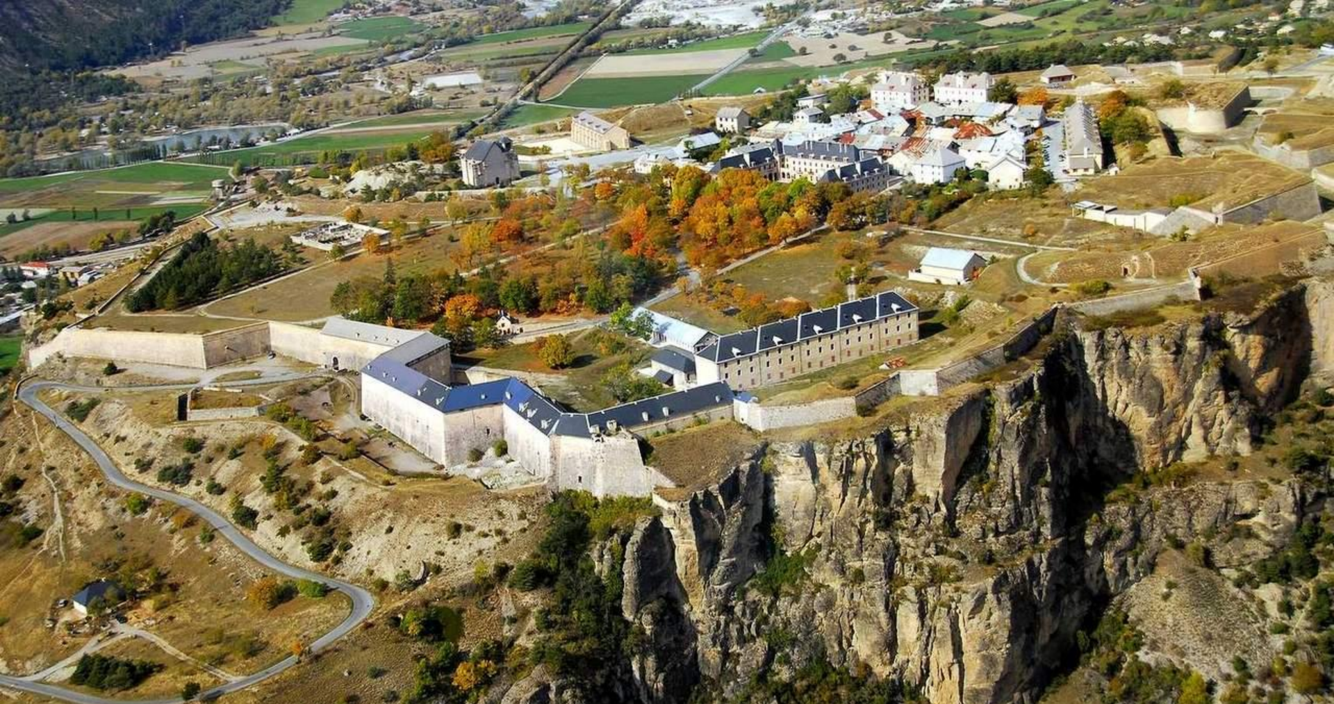
Fortifications de Vauban - Le Mont-Dauphin (Hautes-Alpes)