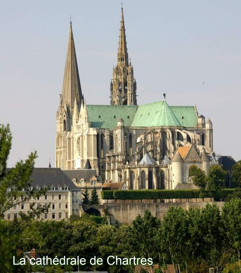
La cathédrale de Chartres