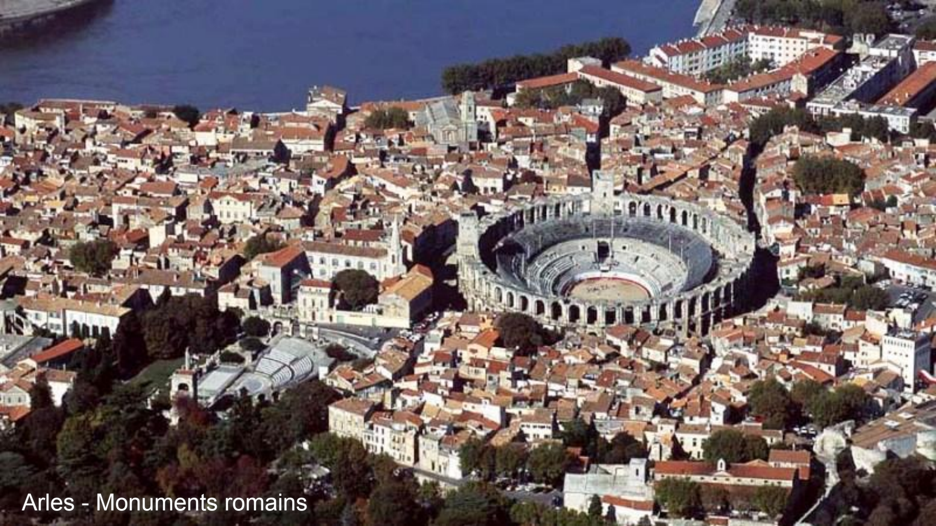
Arles - Monuments romains