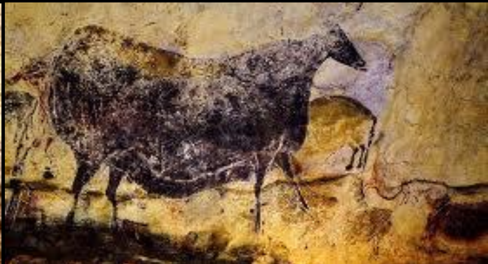
Grottes ornées de la vallée de la Vézère