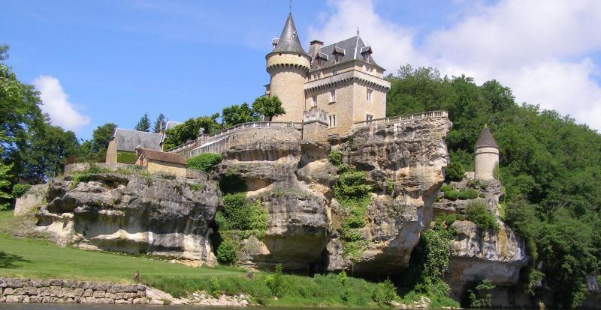
Vallée de la Vézère (Dordogne)