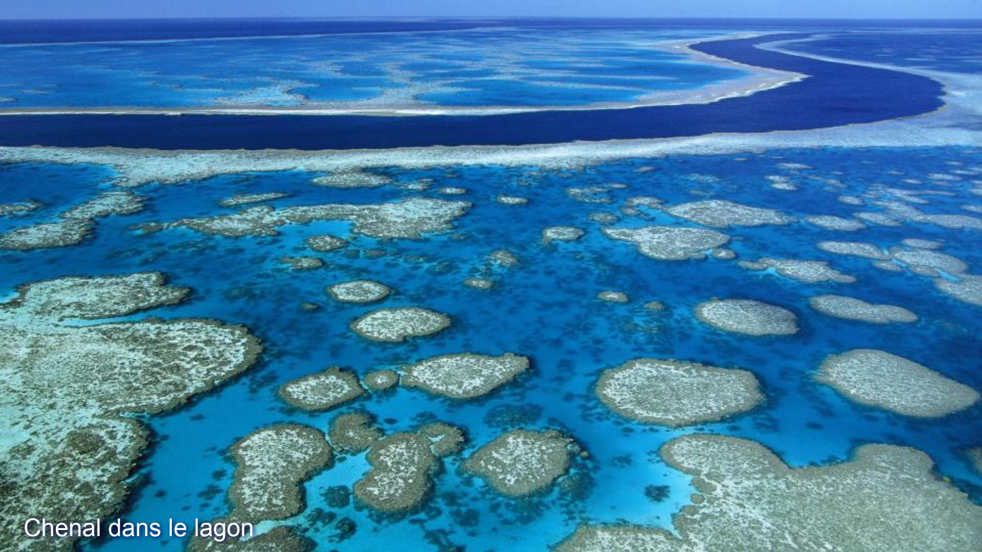
Chenal dans le lagon