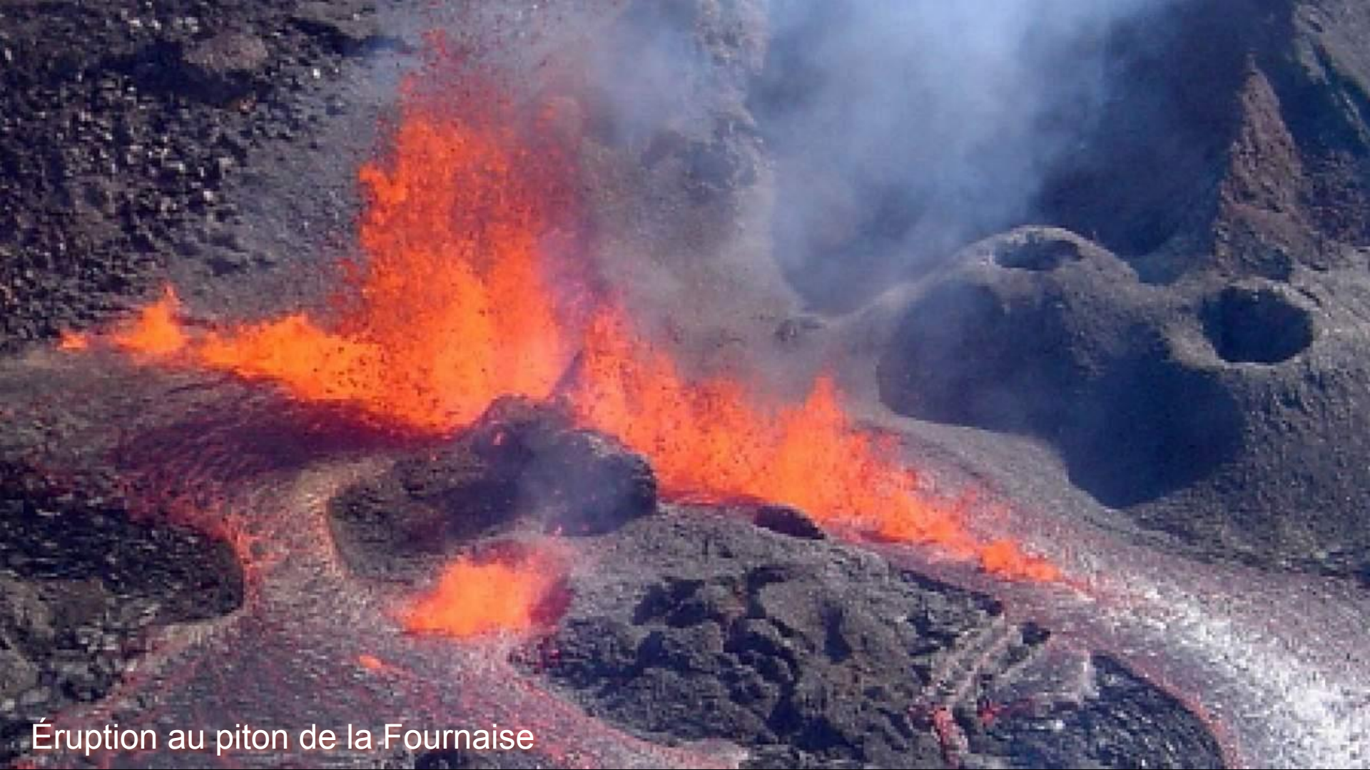
Éruption au piton de la Fournaise