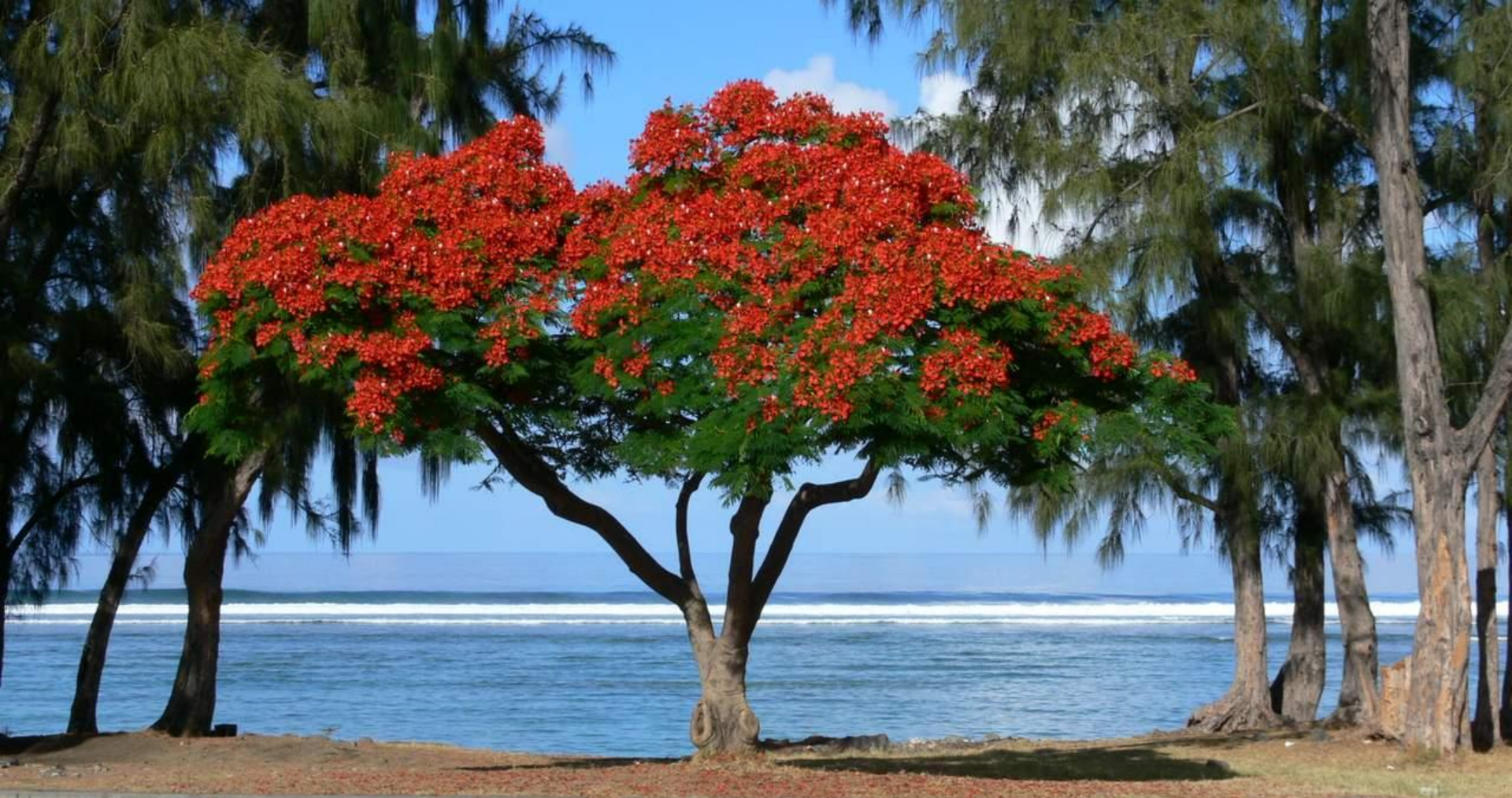
Bord de mer à Saint-Leu