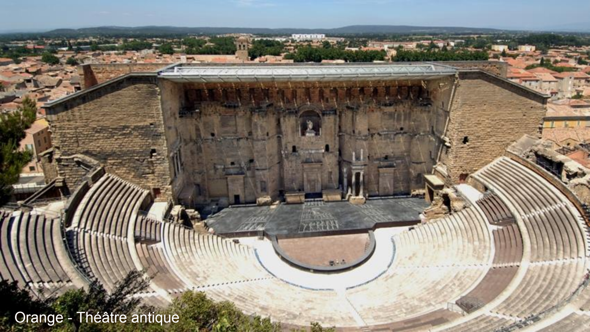
Orange - Théâtre antique