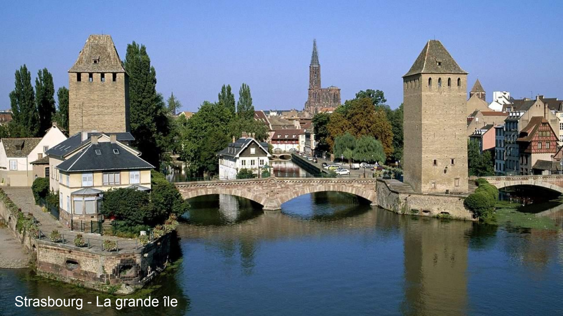
Strasbourg - La grande île