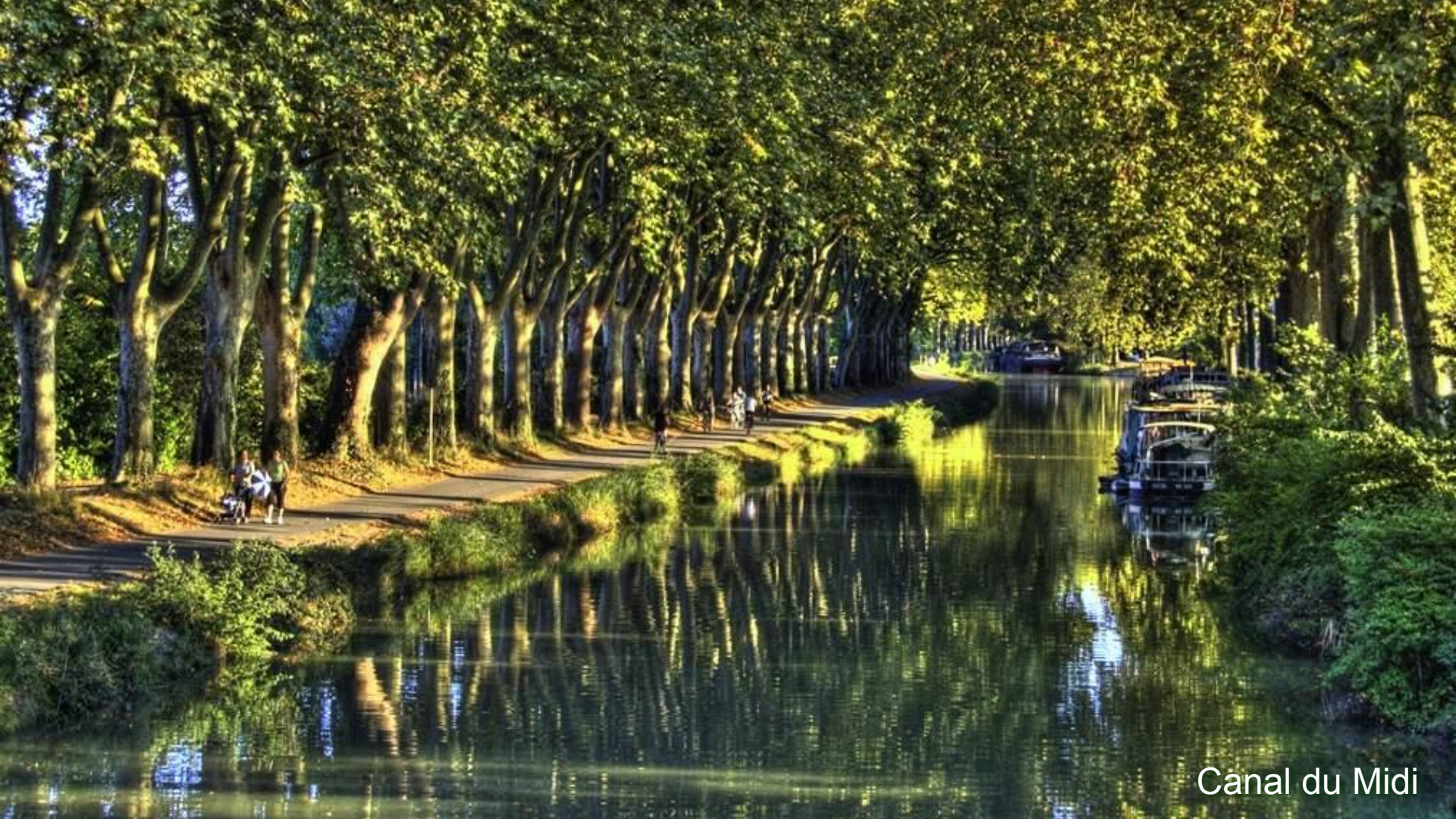
Canal du Midi