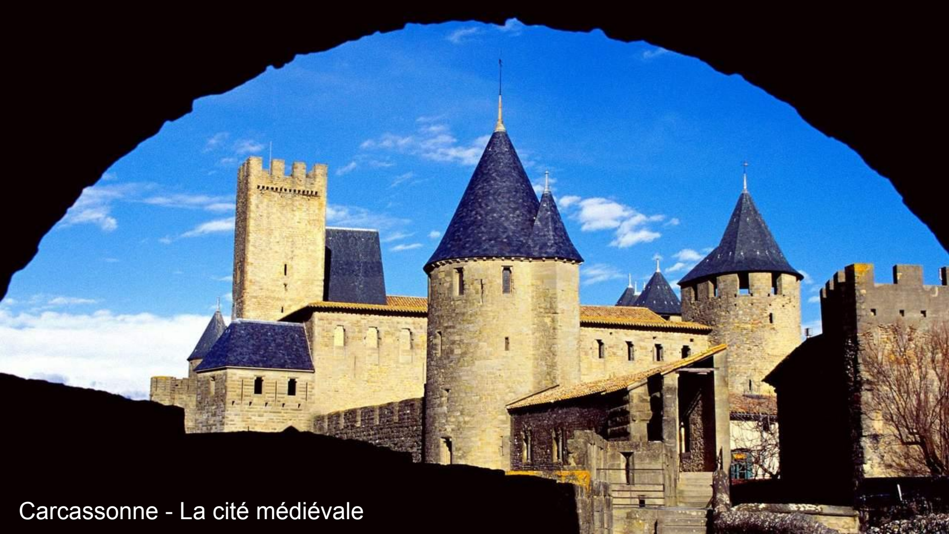
Carcassonne - La cité médiévale