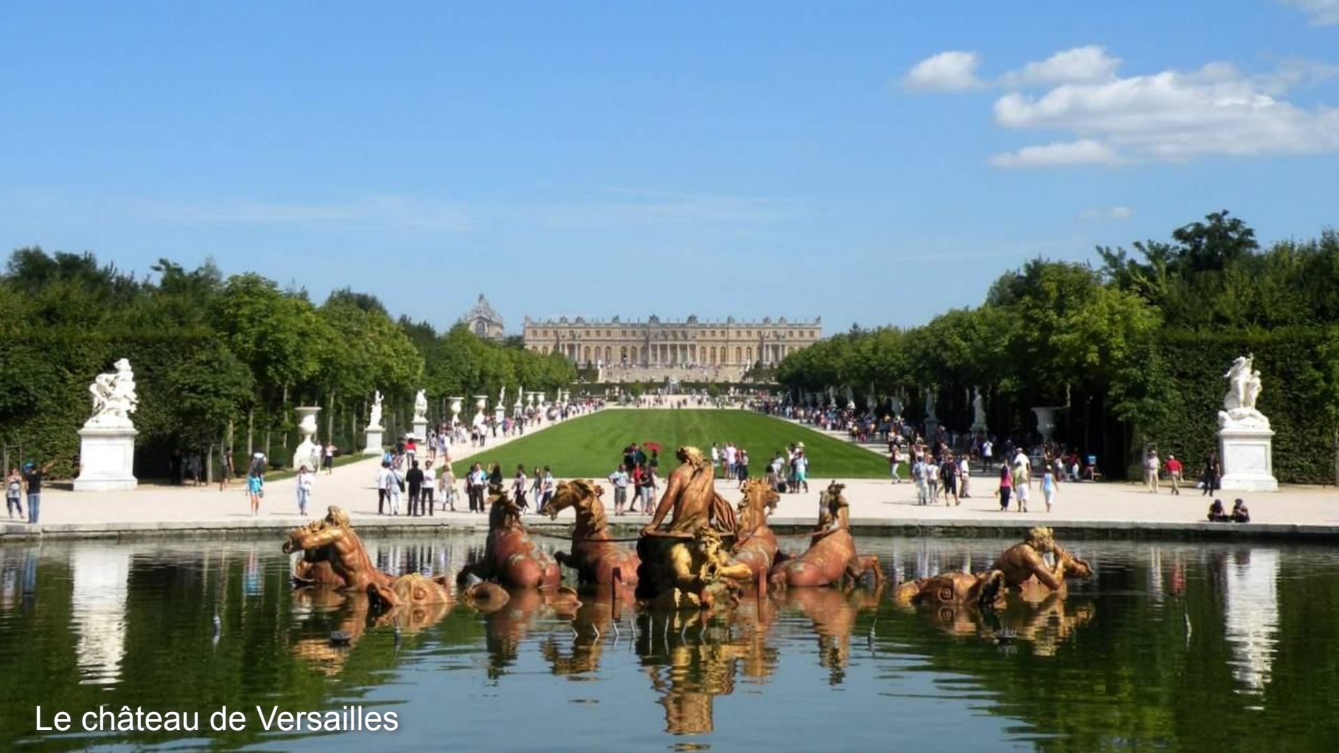
Le château de Versailles