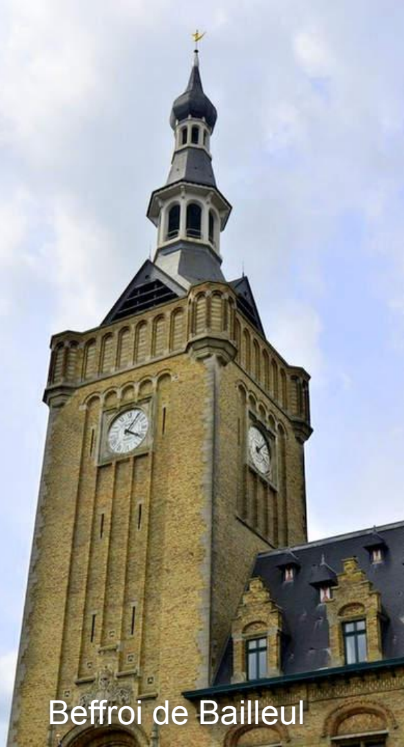
Belfroy de Bailleul