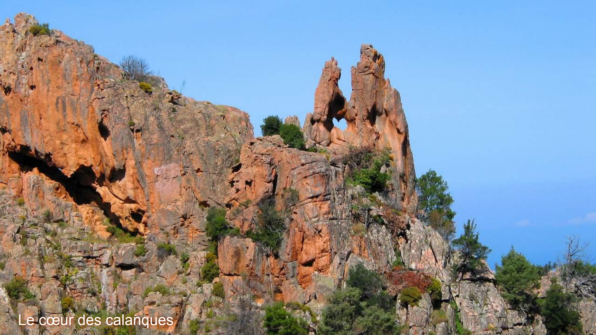
Le cœur des calanques