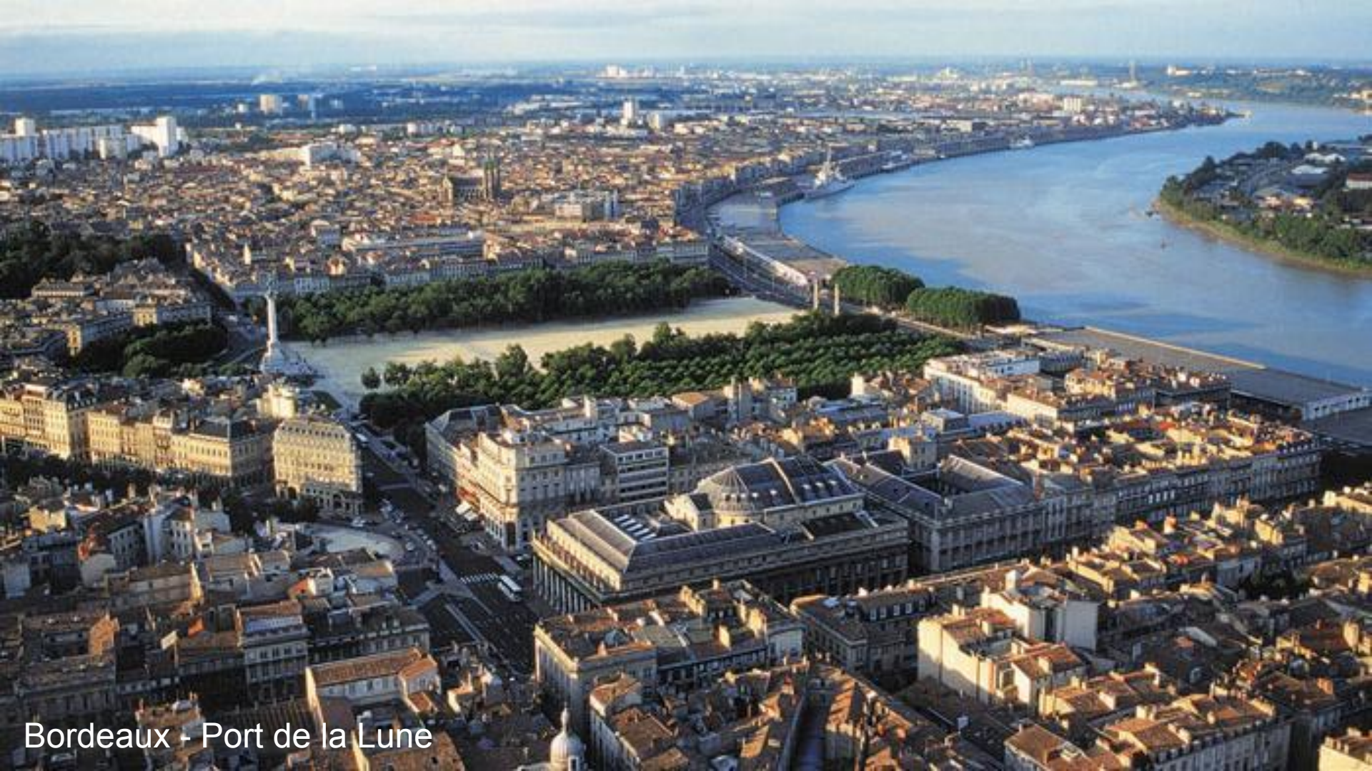
Bordeaux - Port de la Lune