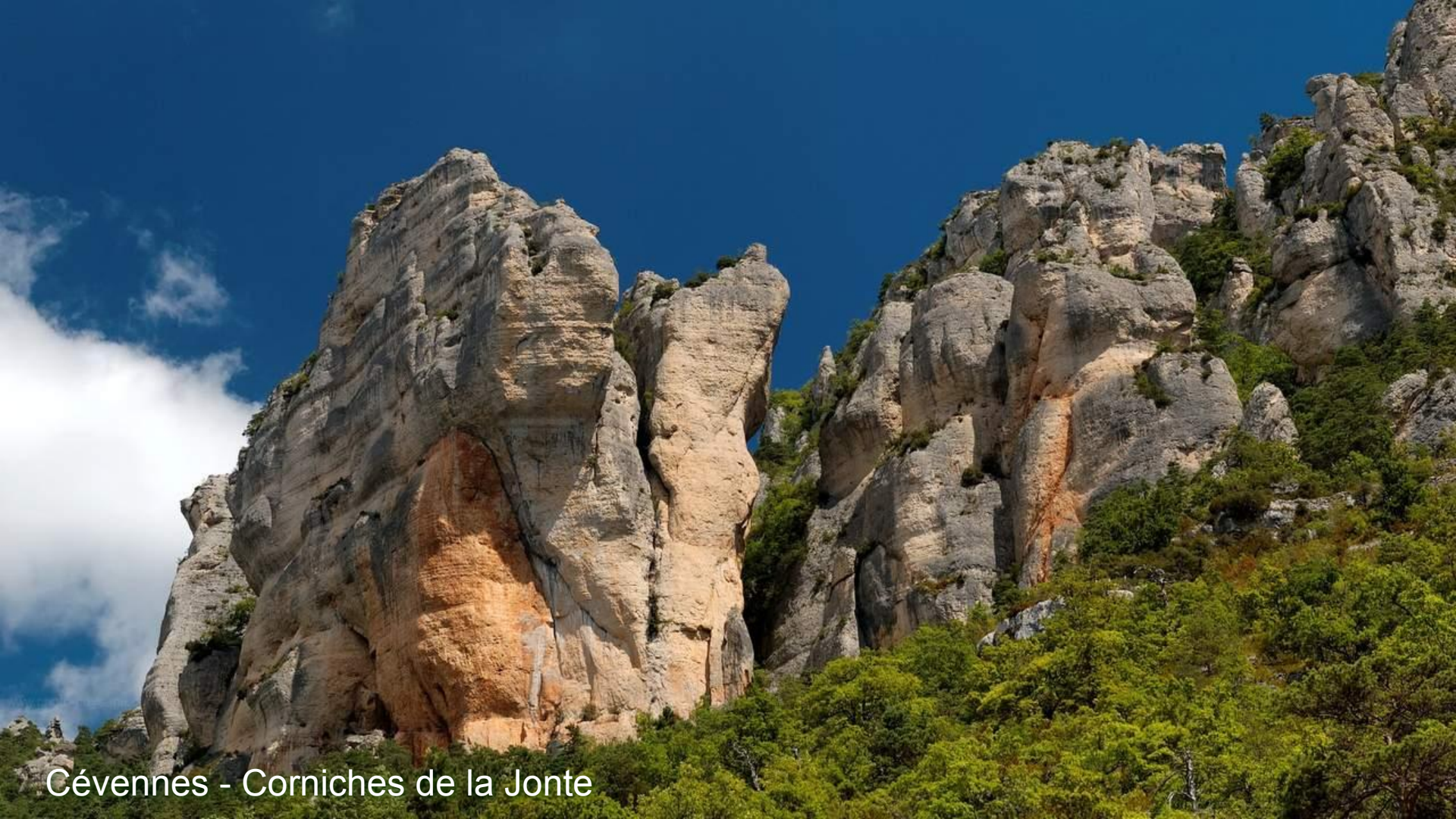
Cévennes - Corniches de la Jonte