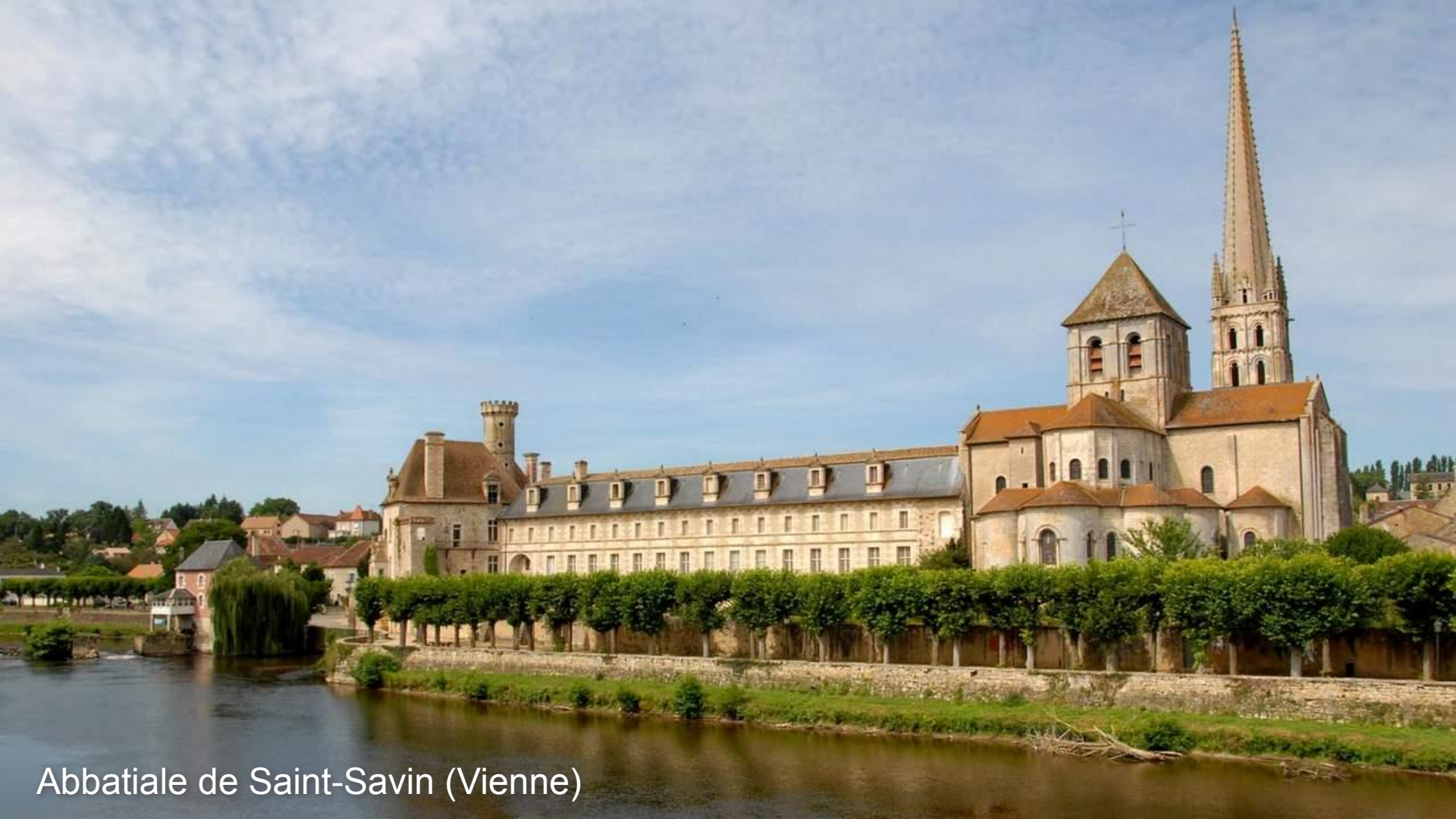
Abbatiale de Saint-Savin (Vienne)