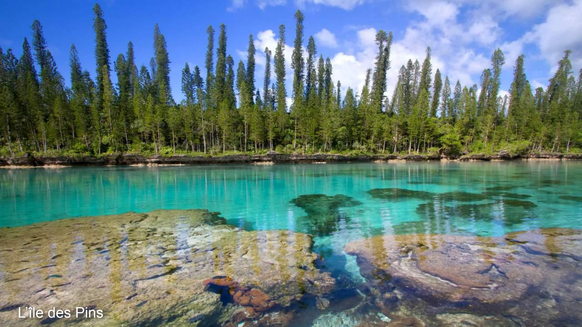
L'île des Pins