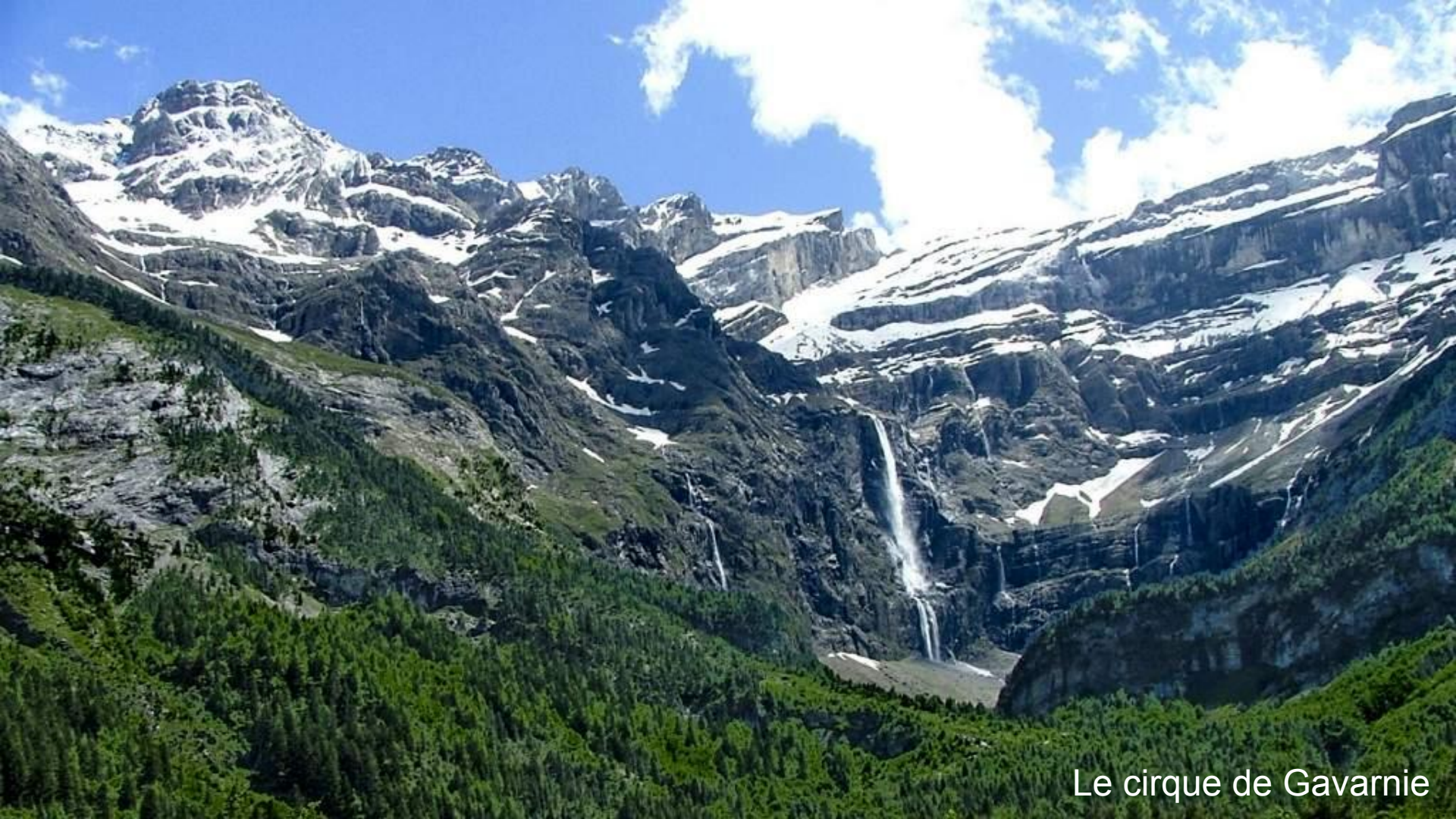
Le cirque de Gavarnie