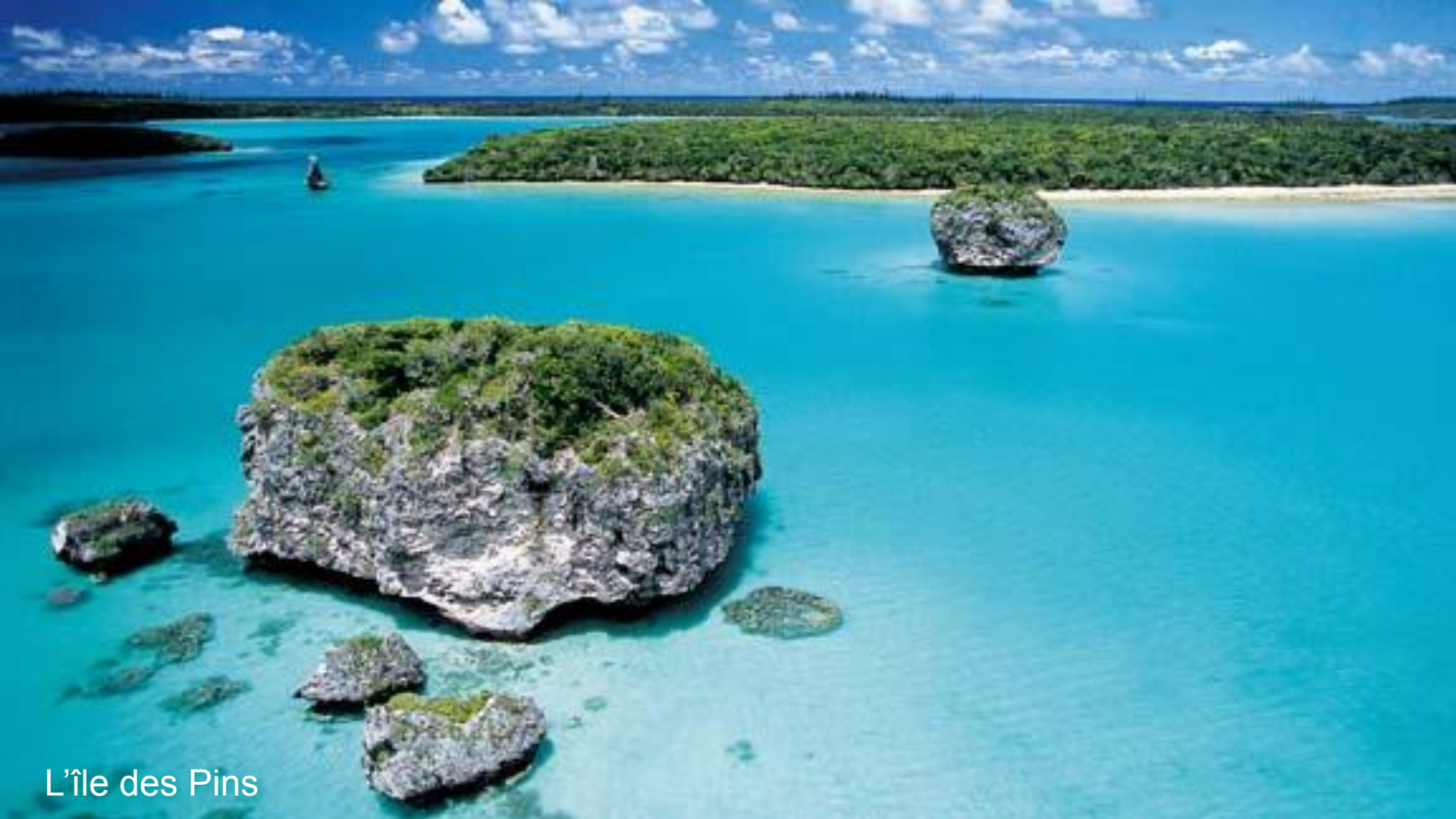
L'île des Pins