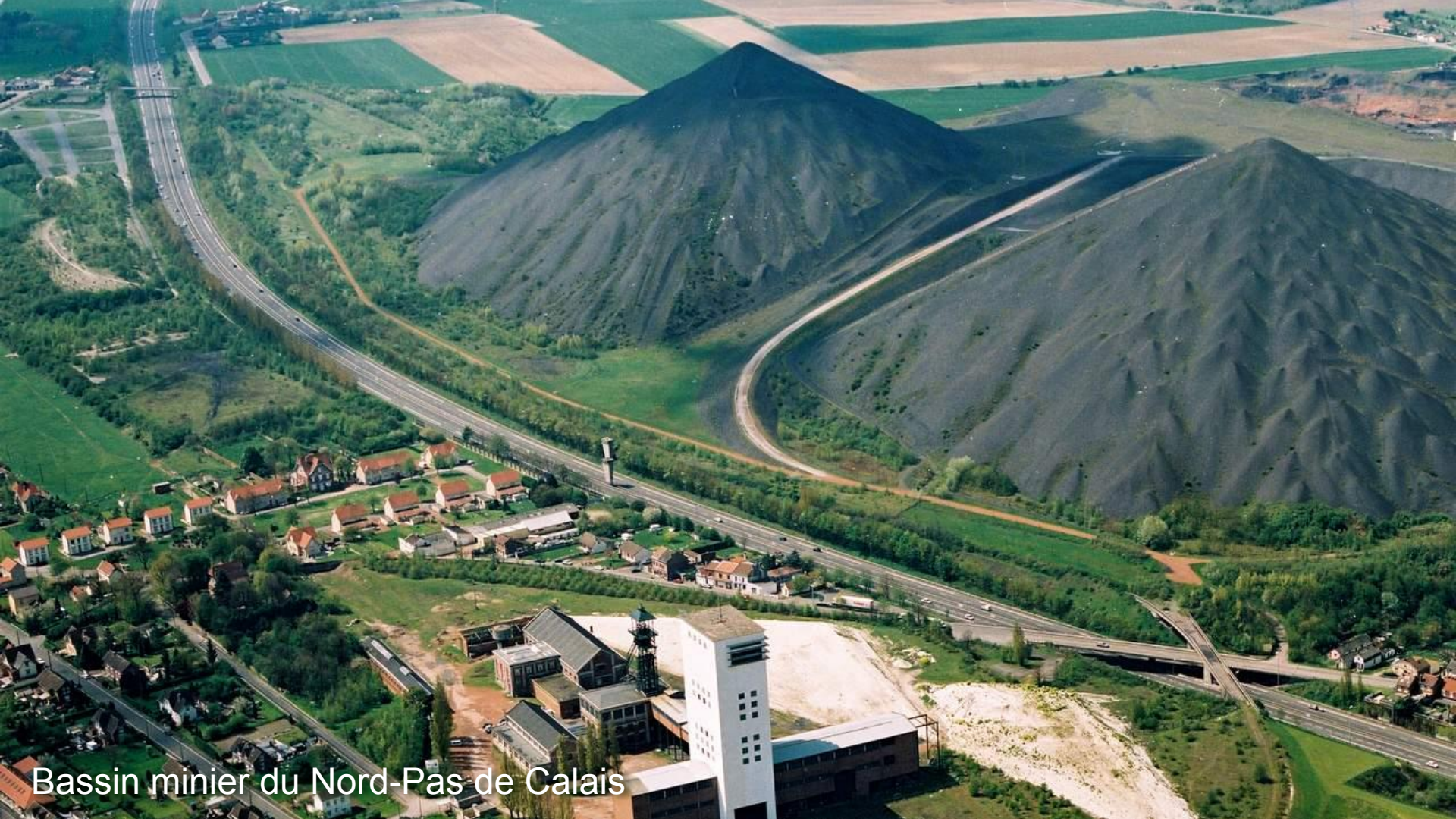
Bassin minier du Nord-Pas de Calais