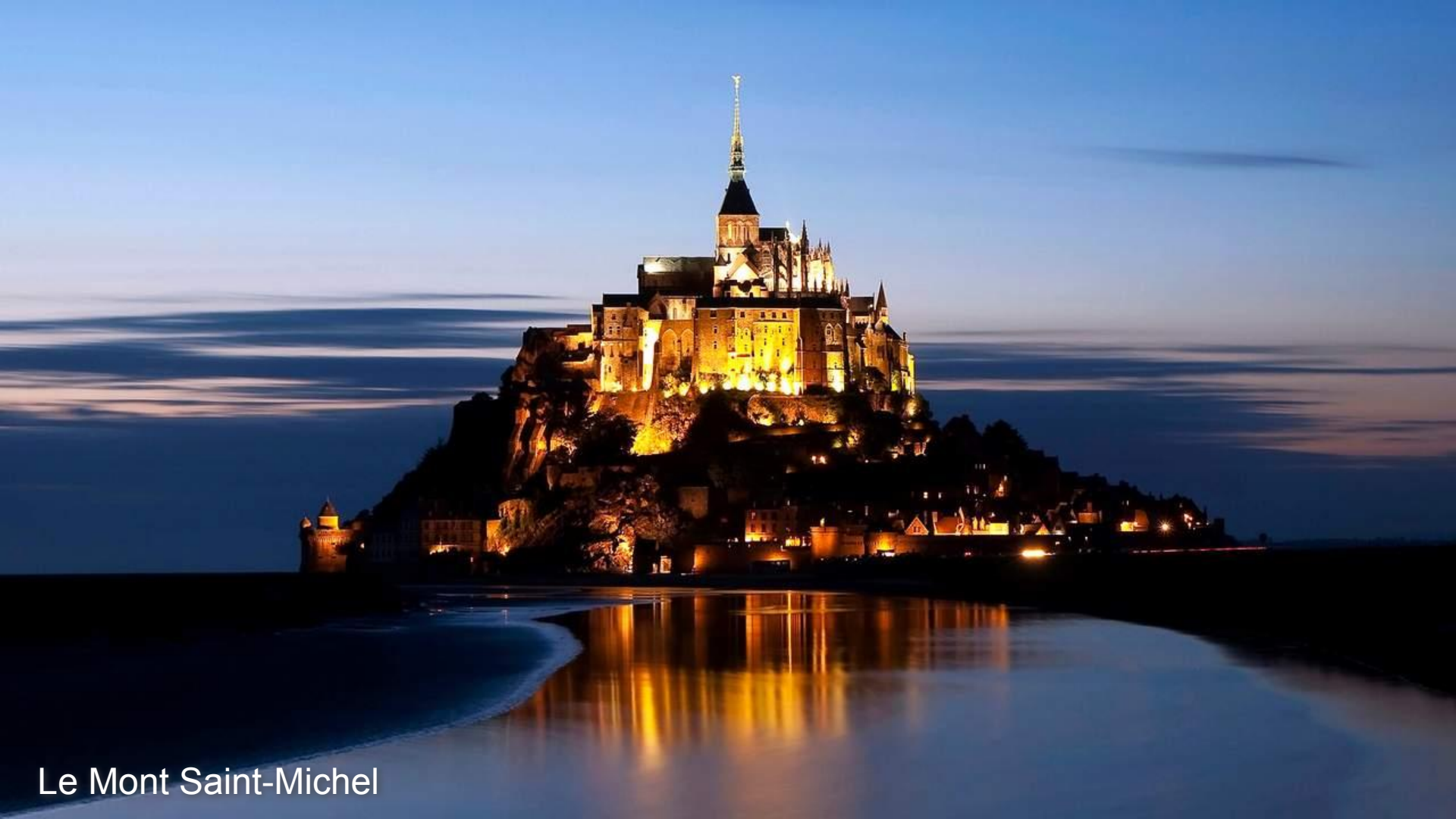
Le Mont Saint-Michel