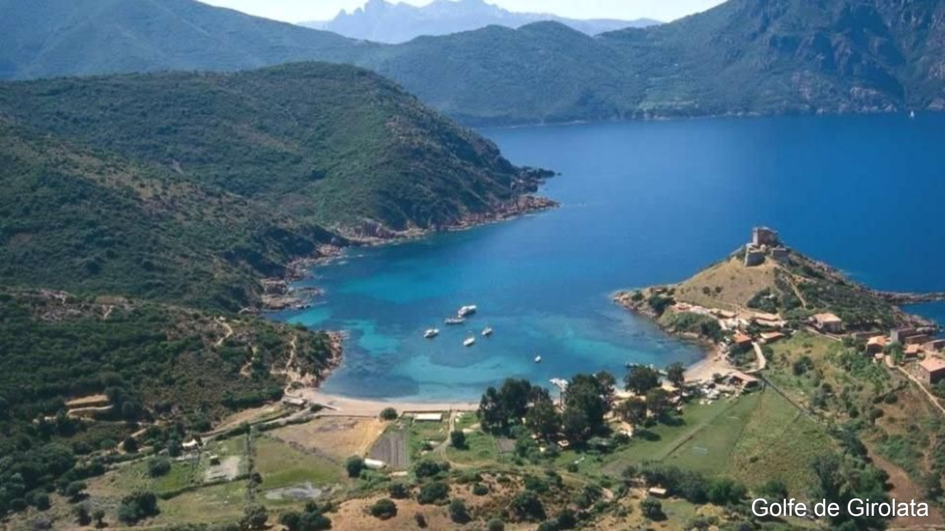
Golfe de Girolata