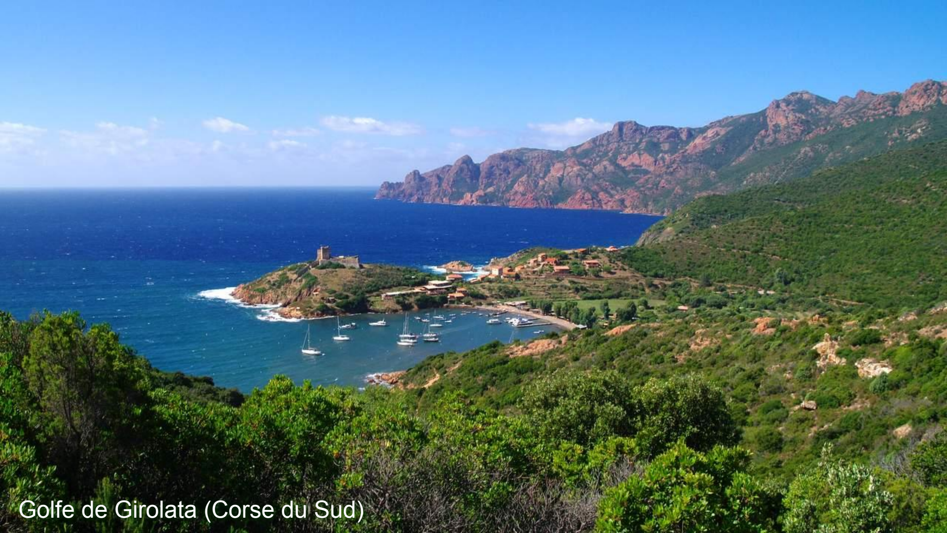
Golfe de Girolata (Corse du Sud)