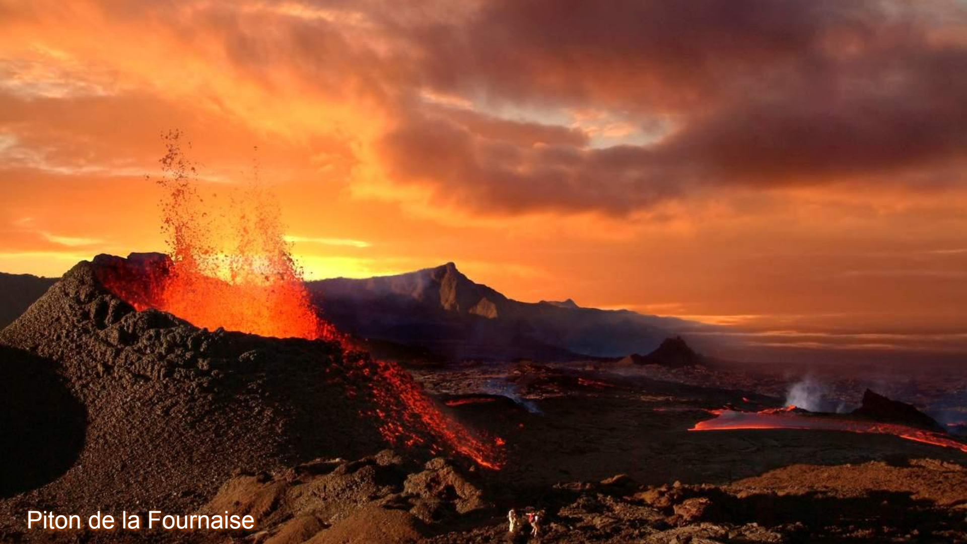
Piton de la Fournaise