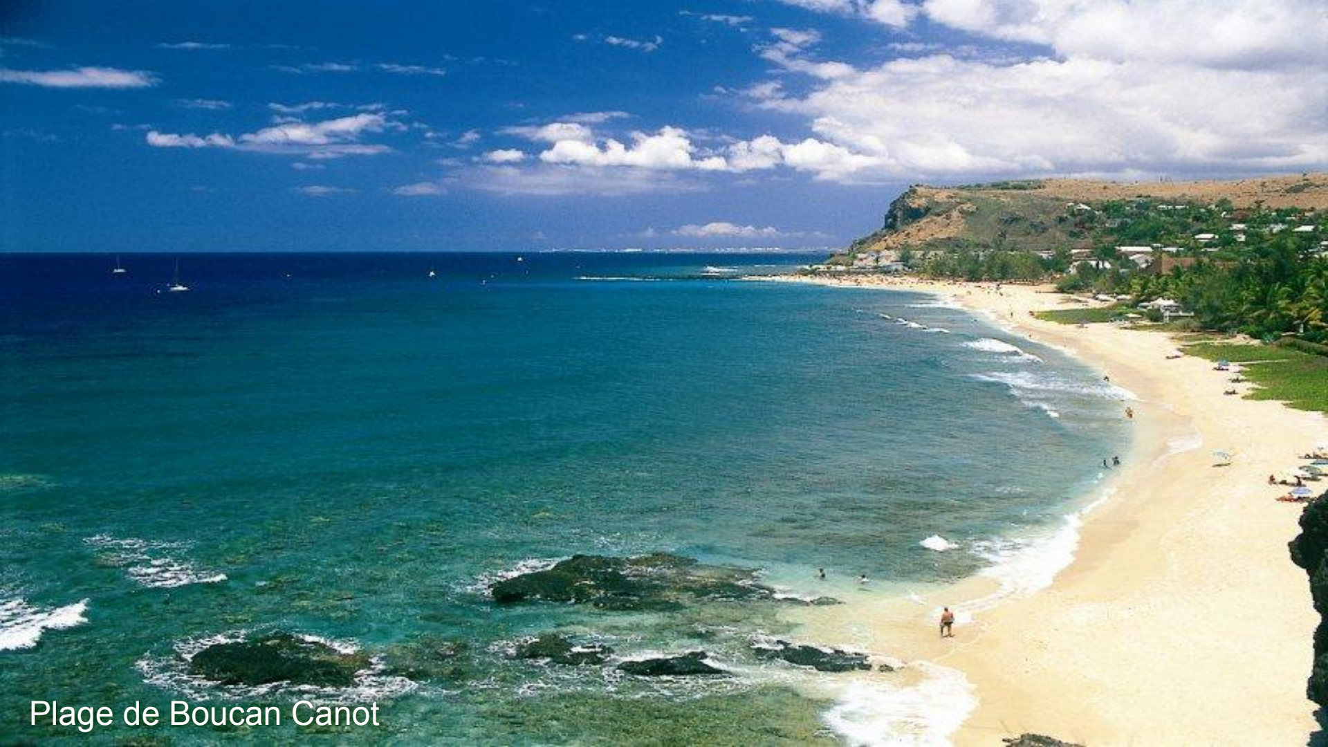
Plage de Boucan Canot