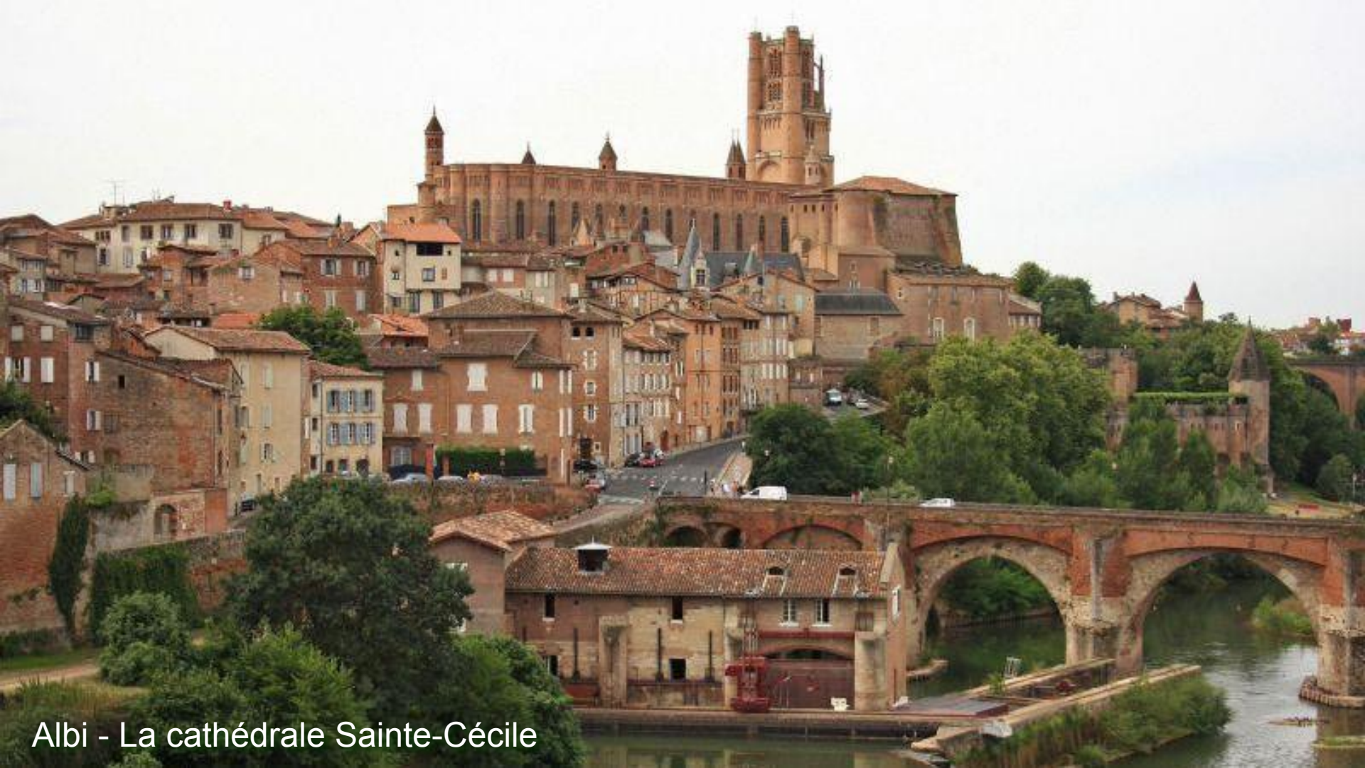
Albi - La cathédrale Sainte-Cécile