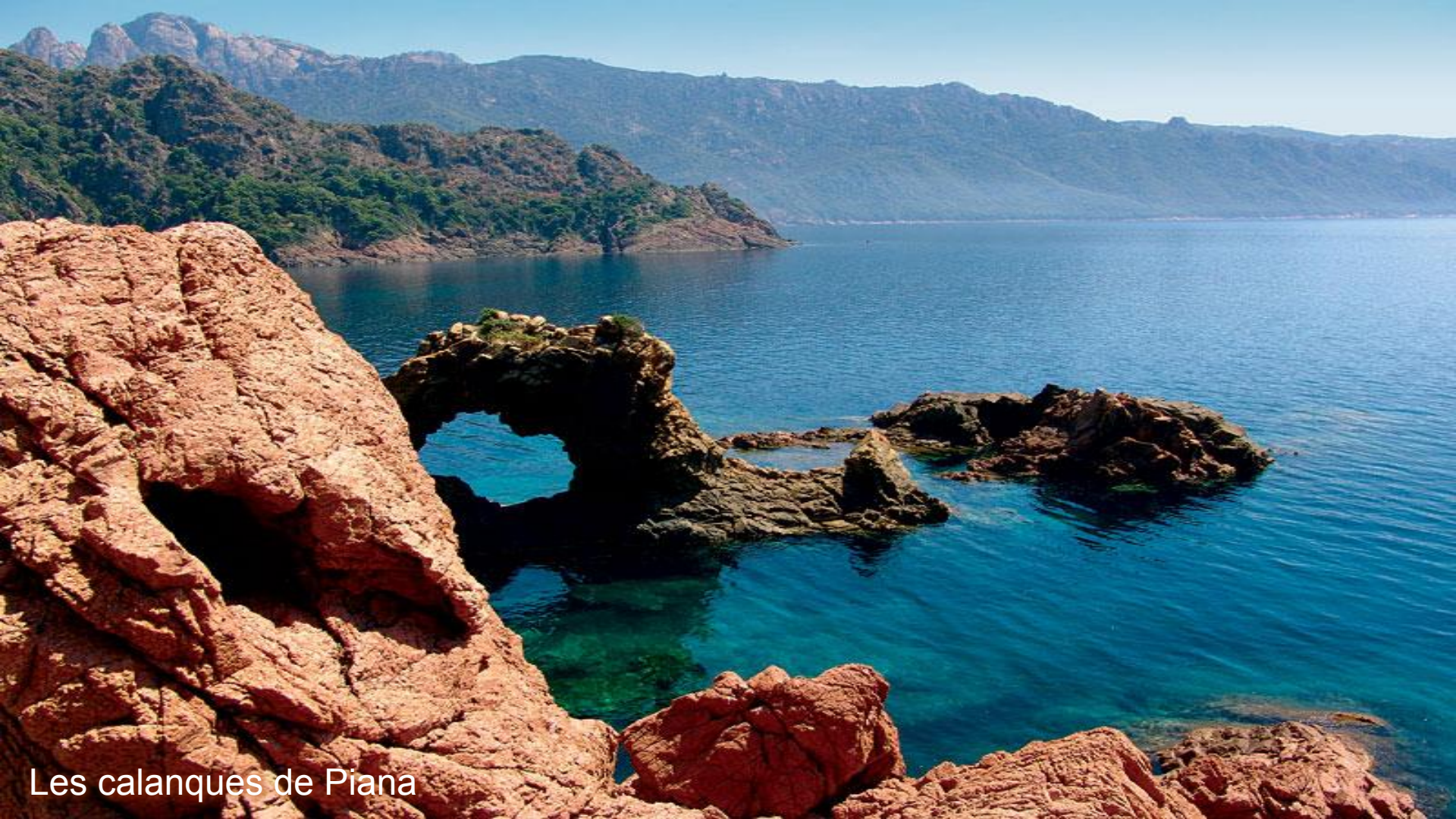
Les calanques de Piana