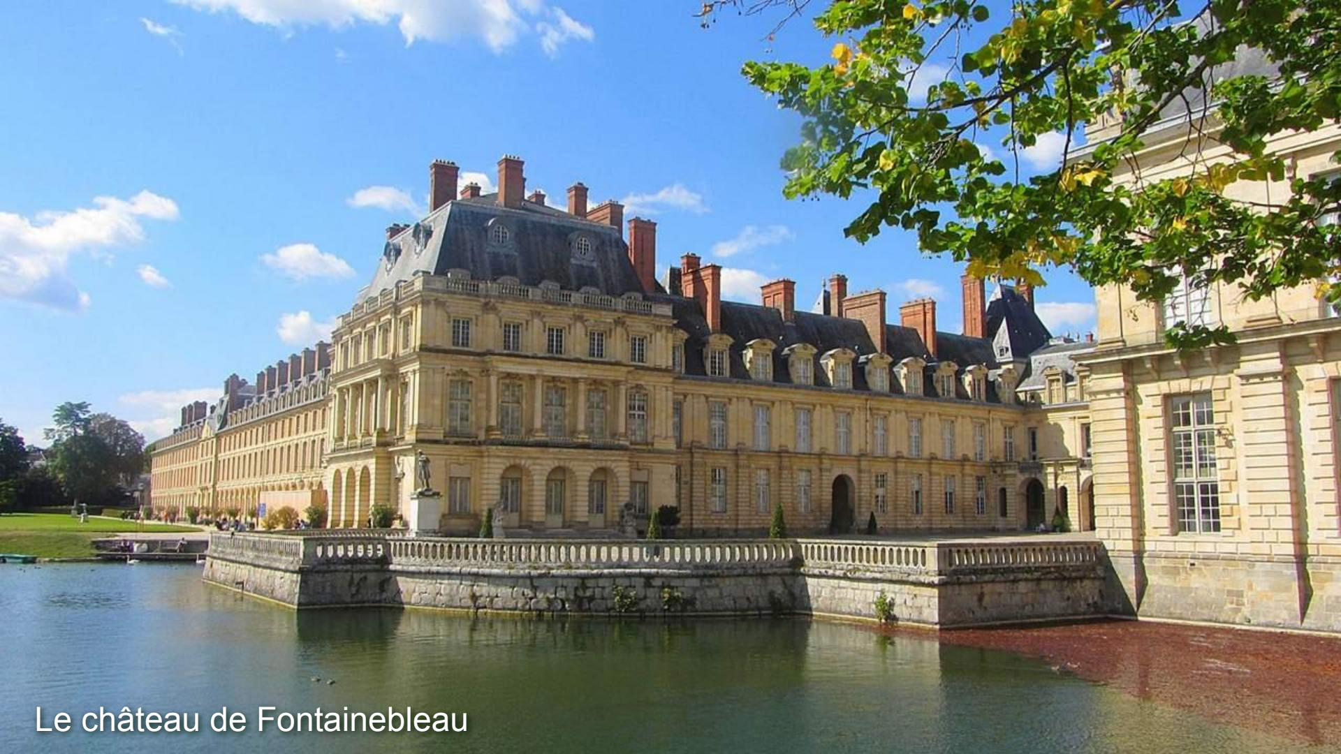
Le château de Fontainebleau