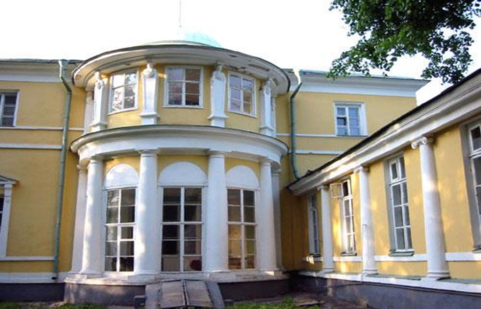
Городской дом помещика