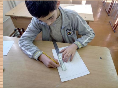
Выполнение графических изображений изделия