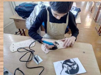
Выжигание рисунка и узоров