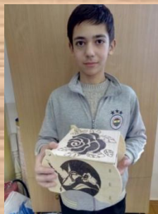
Я и готовое изделие