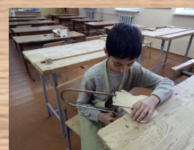
Выпиливание деталей лобзиком