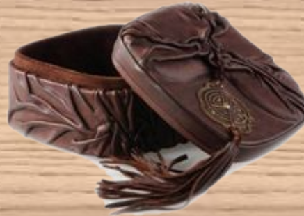
Шкатулка из кожи