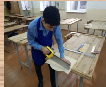
Пиление деталей ножовкой