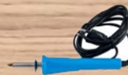
Электровыжигатель по дереву