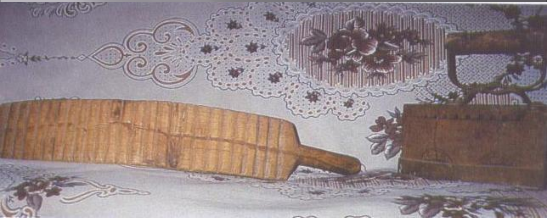
Рубель и утюг