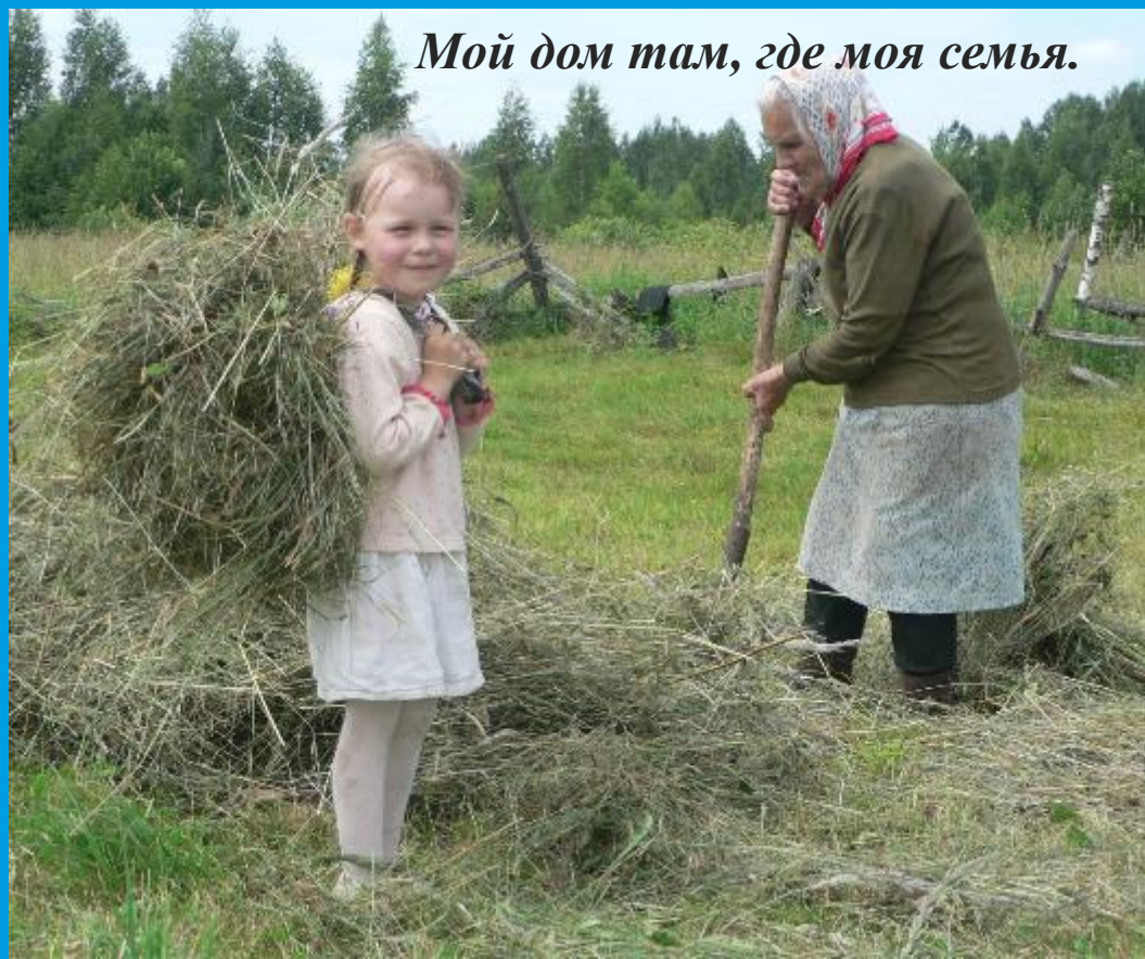
Мой дом там, где моя семья.

Важно, что родители Работали, как со специалистами, так и делились опытом Друг с другом.