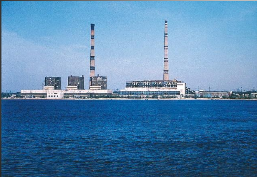
Вуглегірська ТЕС потужністю 3600 МВт

По технологічній структурі теплові електростанції поділяються на блочні й неблочні. При блочній схемі основне і допоміжне обладнання паротурбінної установки не мають технологічних зв'язків з обладнанням іншої установки електростанції. Для електростанцій на органічному паливі при цьому до кожної турбіни пара підводиться від одного або двох з'єднаних з нею котлів. При неблочній схемі ТЕС пара від всіх котлів надходить в загальну магістраль і звідти розподіляється по окремих турбінах.