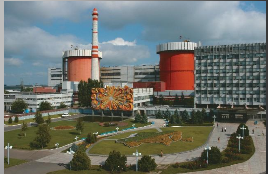
Південно-Українська АЕС потужністю 3000 МВт