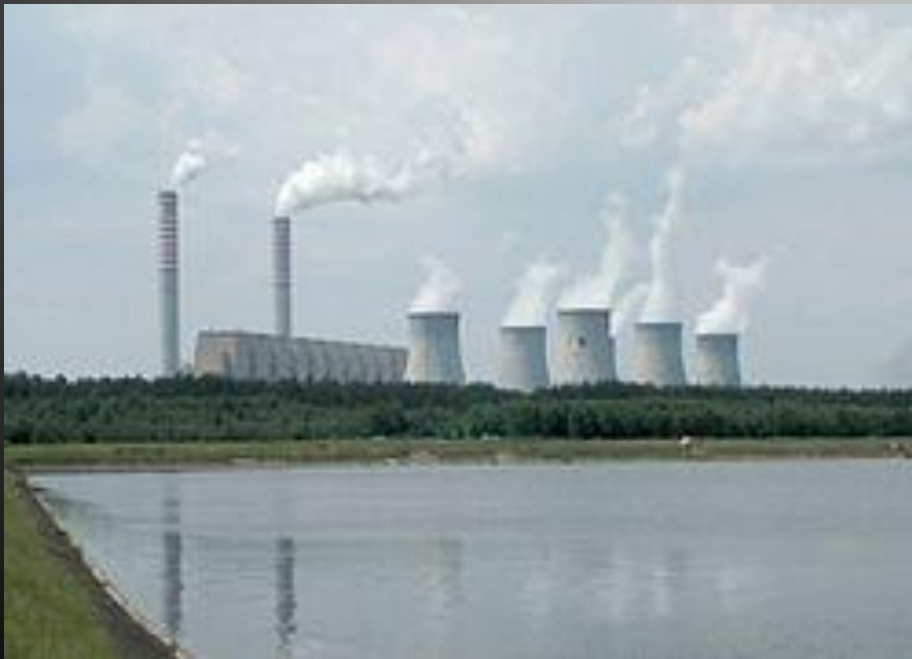
Теплова електростанція. Зовнішній вигляд.

Теплова електростанція (ТЕС) - електростанція , в якій первинна енергія має хімічну форму і вивільняється шляхом спалювання вугілля , рідкого палива чи газу ; на парових електростанціях (з паровими турбінами ) у топці парового котла відбувається перетворення хімічної енергії палива в тепло газів — продуктів згоряння; це тепло передається воді та водяній парі, пара з котла надходить до парової турбіни , де тепло перетворюється на кінетичну енергію обертання електрогенератора , з'єданого з турбіною; відпрацьована в турбіні пара надходить до конденсатора і віддає тепло охолоджувальній воді (наприклад, з річки); на деяких електростанціях застосовують замість парової газову турбіну .