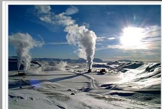
Геотермальна електростанція Крафла у Ісландії.