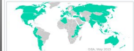
Країни, в яких працюють або розроблені проекти геотермальних електростанцій