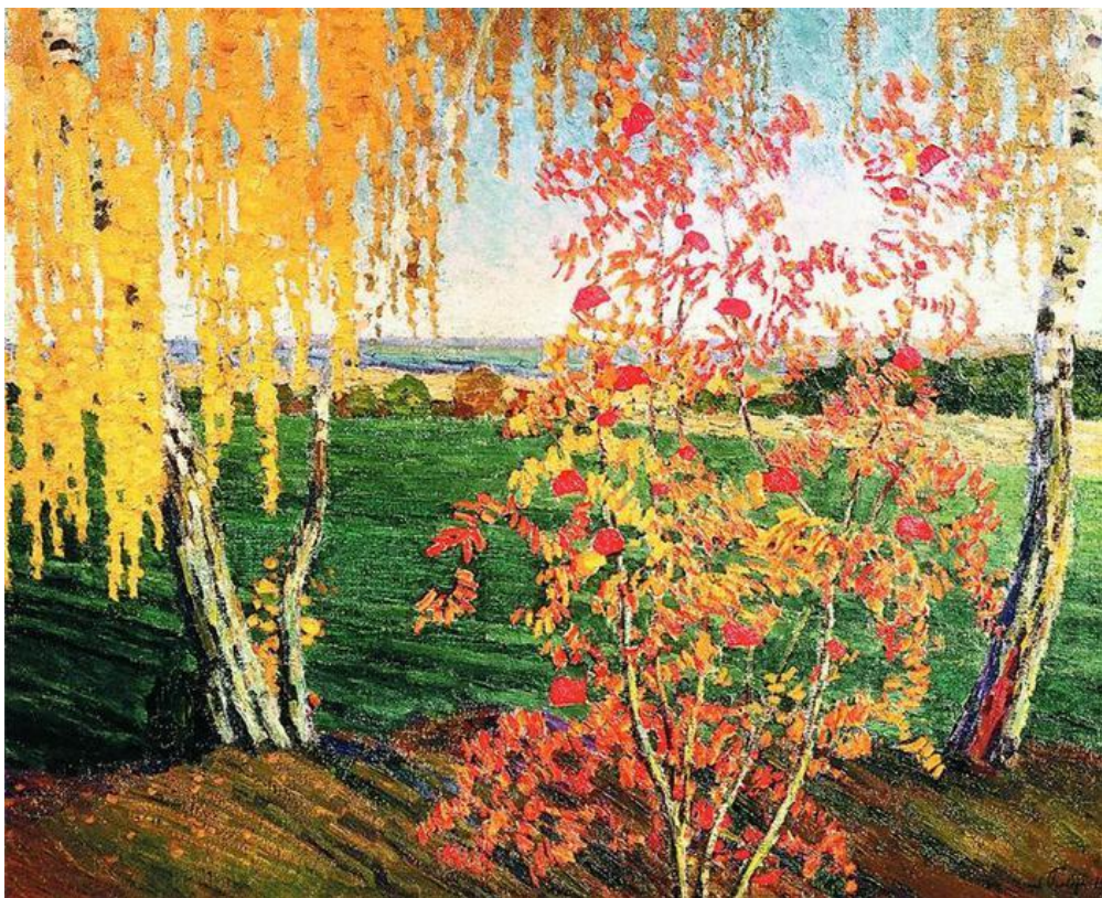
Игорь Эммануилович Грабарь.Рябинка [1915]