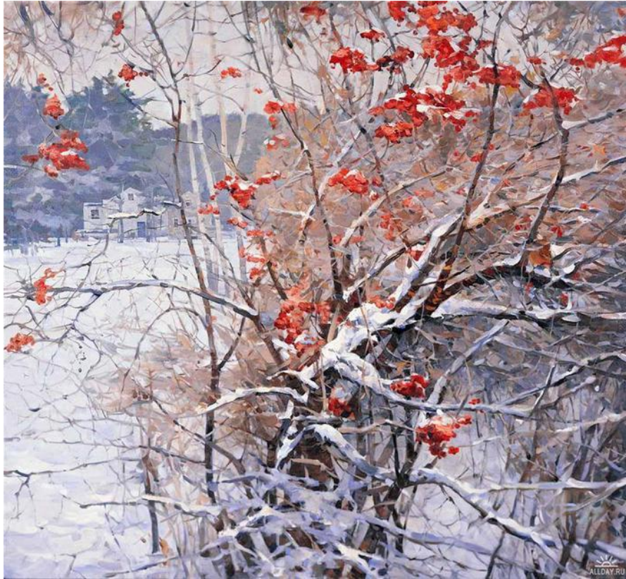
Василий Нестеренко. Рябина в снегу.

Рябина окружена любовью и воспета в народном творчестве. А, возможно, что рябина опоэтизирована человечеством больше, чем любое другое растение на Земле.