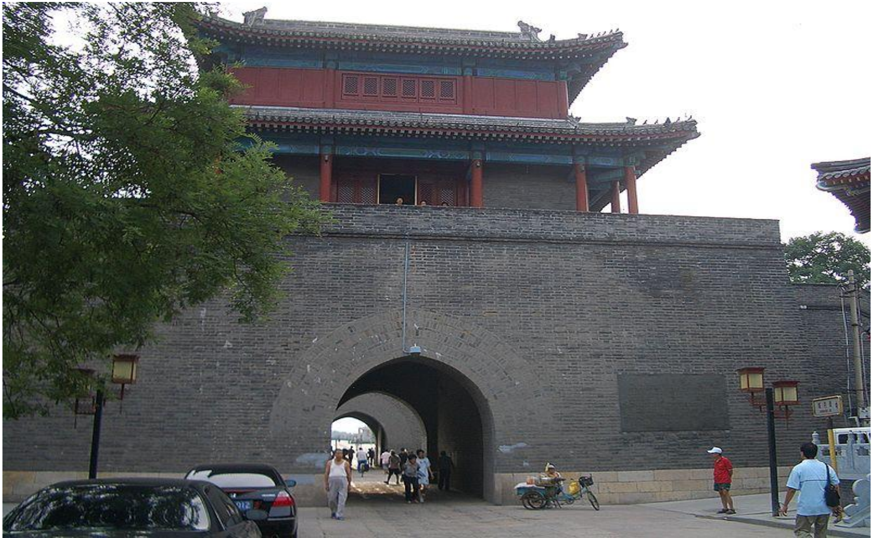
Крепость Ваньпин , возведённая для защиты Пекина от войск Ли Цзычэна