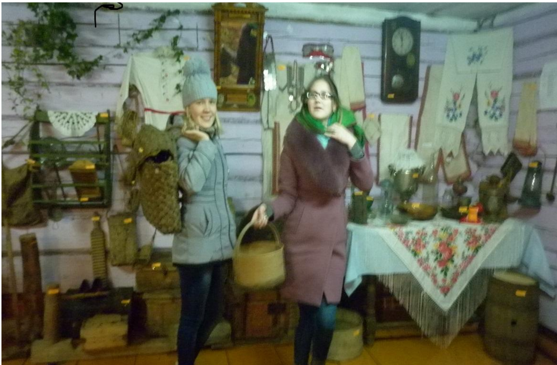
Активные читатели библиотеки