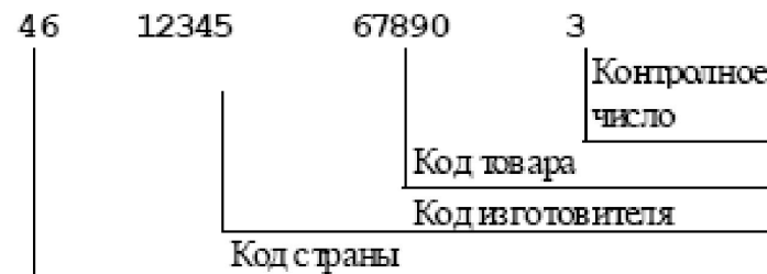
Рис. 2.5. 13-разрядный товарный код EAN