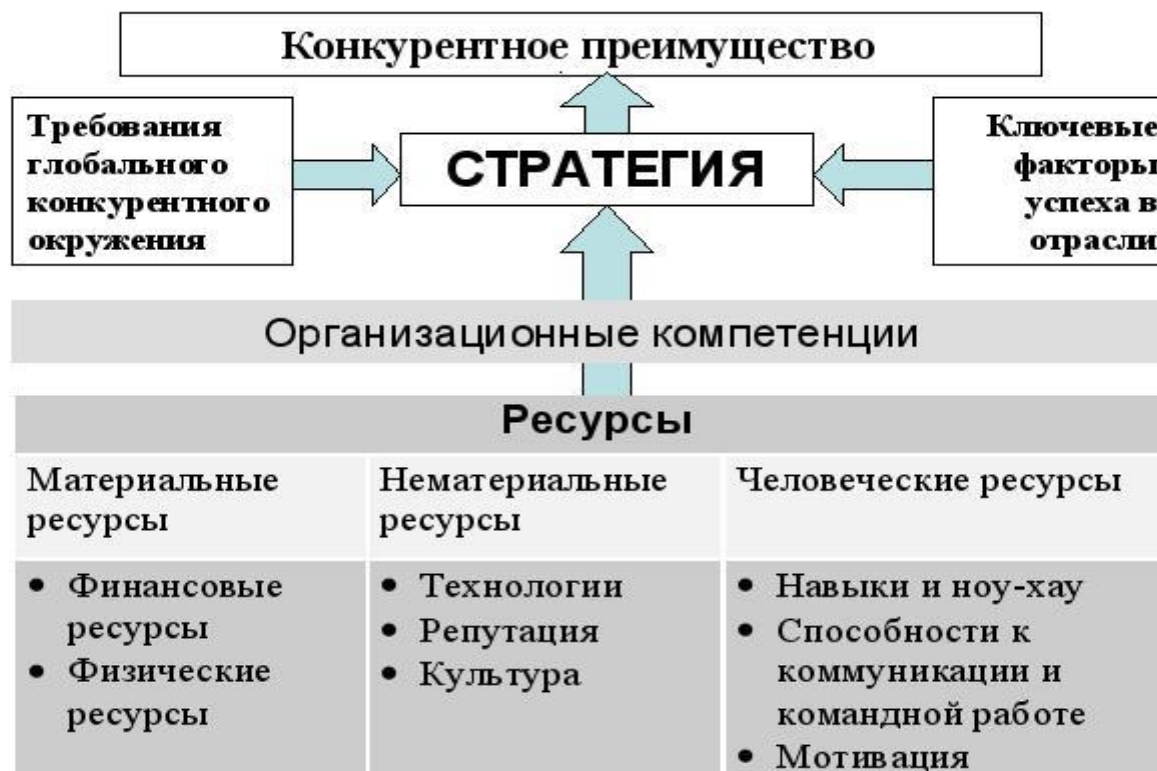
Схема Р. Гранта