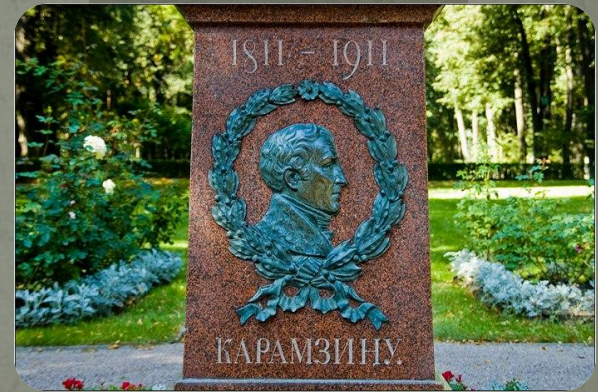
Памятник Н.М. Карамзину 1911 г.