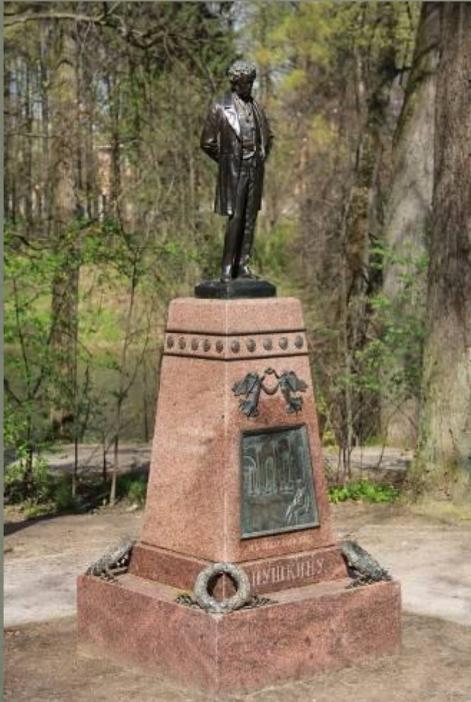
Памятник А.С. Пушкину