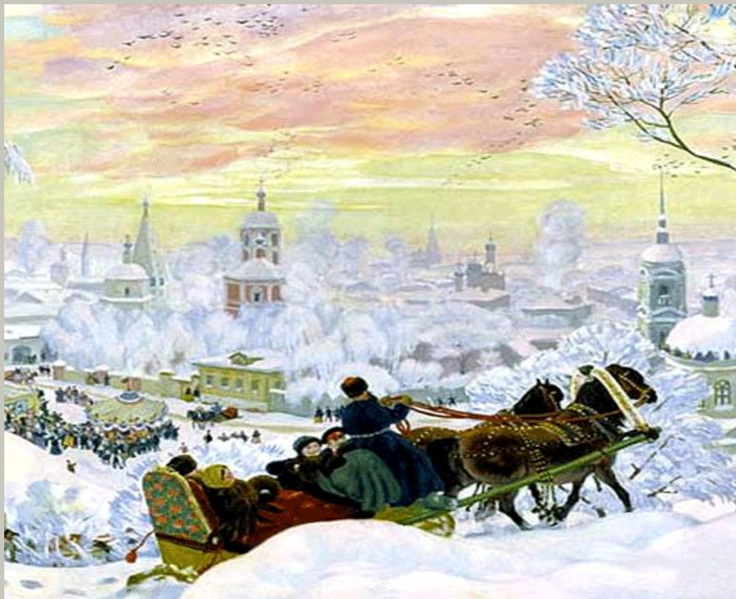
Б. М. Кустодиев «Масленица»