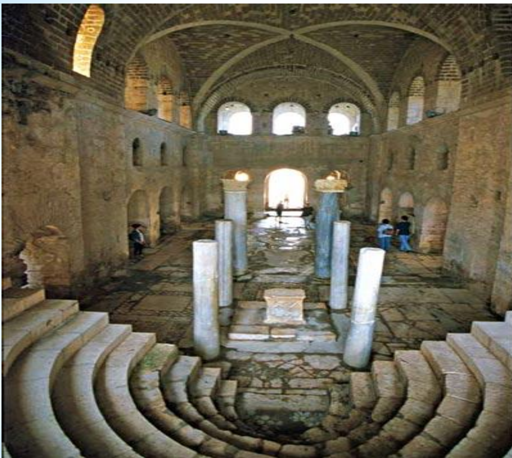
* Церковь Святого Николая в Демре