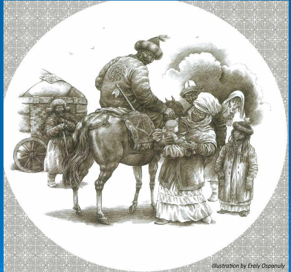
Illustration by Eraly Ospanuly