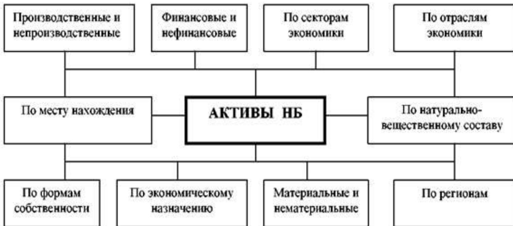
Рис. 5.2. Группировка активов национального богатства