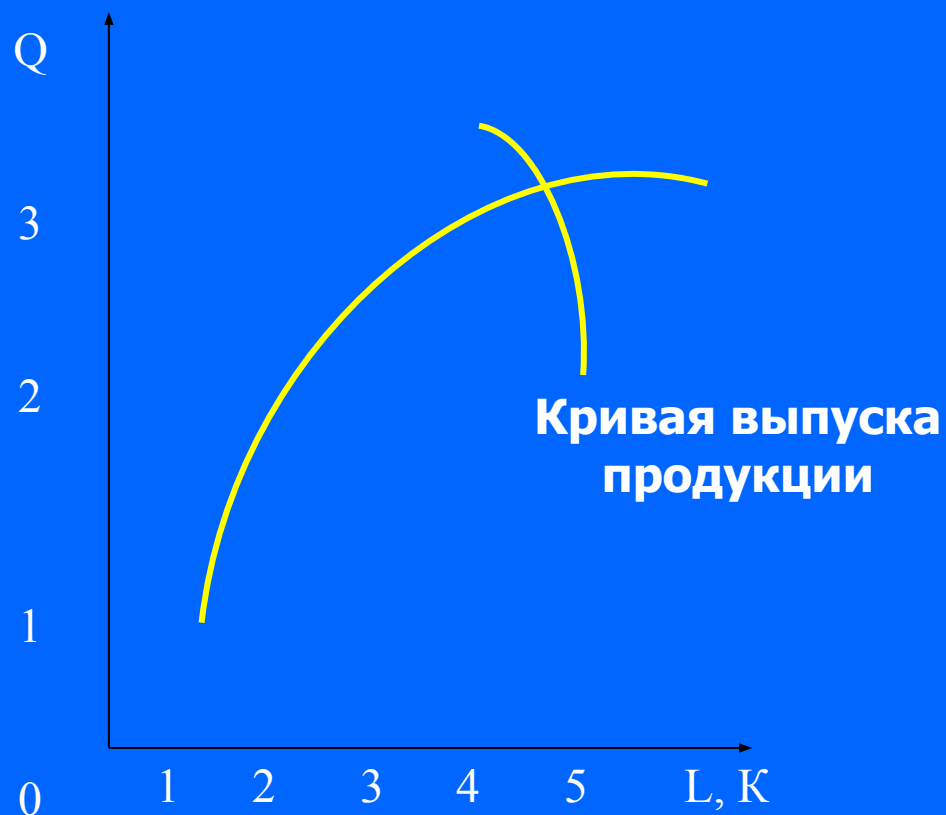
Рис. 1. Замещение предельного продукта от изменения факторов труда или капитала