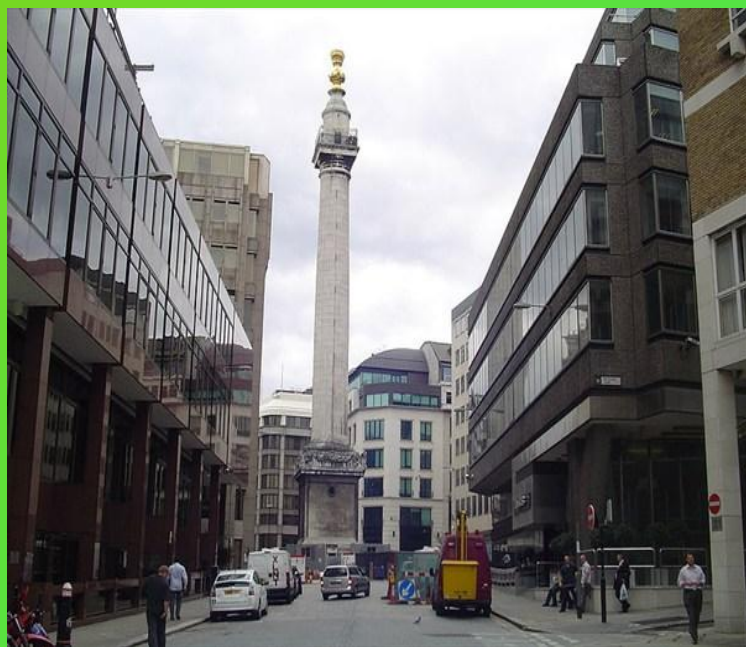
Памятник Великому лондонскому пожару 1666 г.