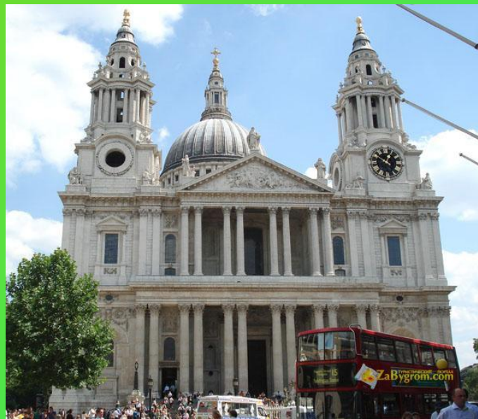
Собор Святого Павла

Территория Сити занимает одну квадратную милю, здесь проживают немногим больше тысячи человек.