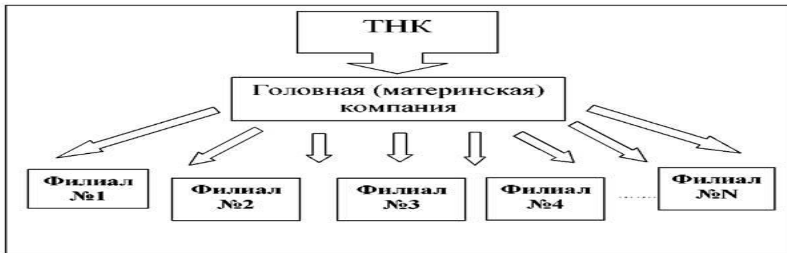
Рис. 9.10. Сеть филиалов транснациональной компании.

Транснациональная корпорация — фирма владеющая производственными подразделениями в нескольких странах и управляющая ими из одного или нескольких центров. Принадлежать к ТНК, как правило, способна фирма в которой очень высокий уровень эффективности управления сравнимый с государственным. Причём, не всегда, именно качество продукции ТНК играет решающую роль