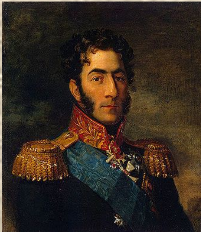
ПЕТР ИВАНОВИЧ БАГРАТИОН

В Бородинском сражении П.И.Багратион руководил левым флангом, на который пришелся главный удар французов, и героически оборонял Семеновские флеши; возглавил контратаку 2-й гренадерской дивизии на Северную флешь, занятую французами, и был смертельно ранен.