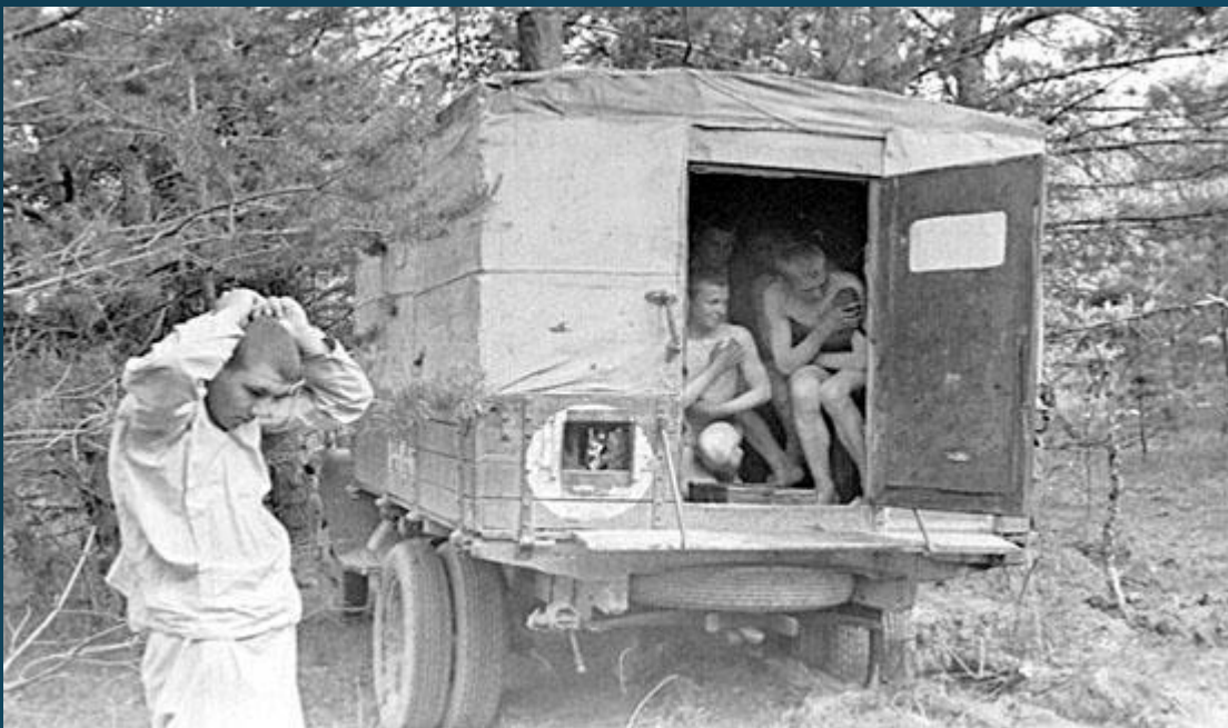
Бойцы гвардейской стрелковой дивизии моются в передвижной бане на передовых позициях Западного фронта.(1942 г.)