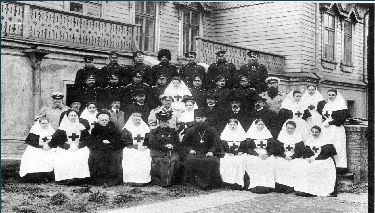
Санитарный отряд военно-санитарного поезда императрицы Марии Федоровны