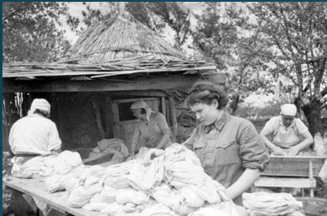
Стирка белья для бойцов Красной Армии в одной из прифронтовых прачечных