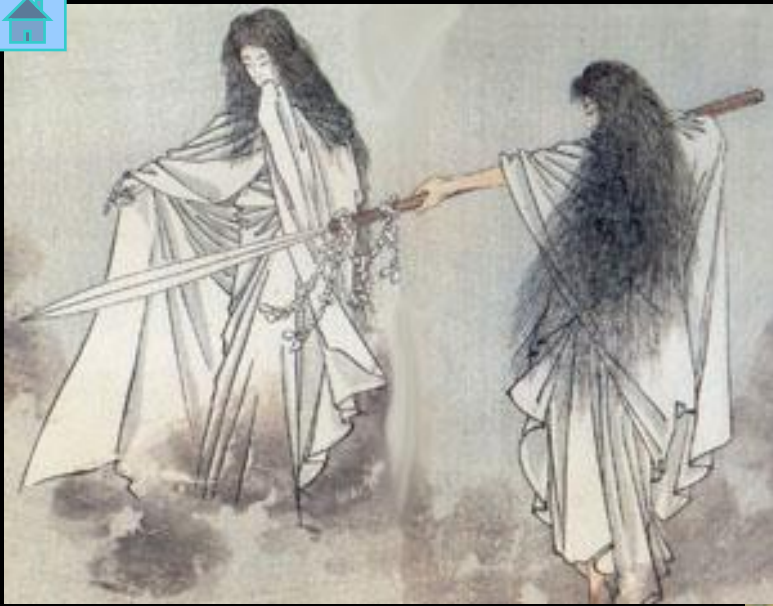
Идзанаки и Идзанами (сотворение земли)