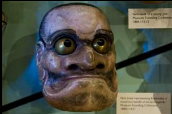
Ichimasa, 11 a young god Musée Fenning Collection 1884.114.15