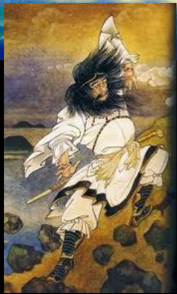
Сусаноо (бог бури), победивший змея Идзумо