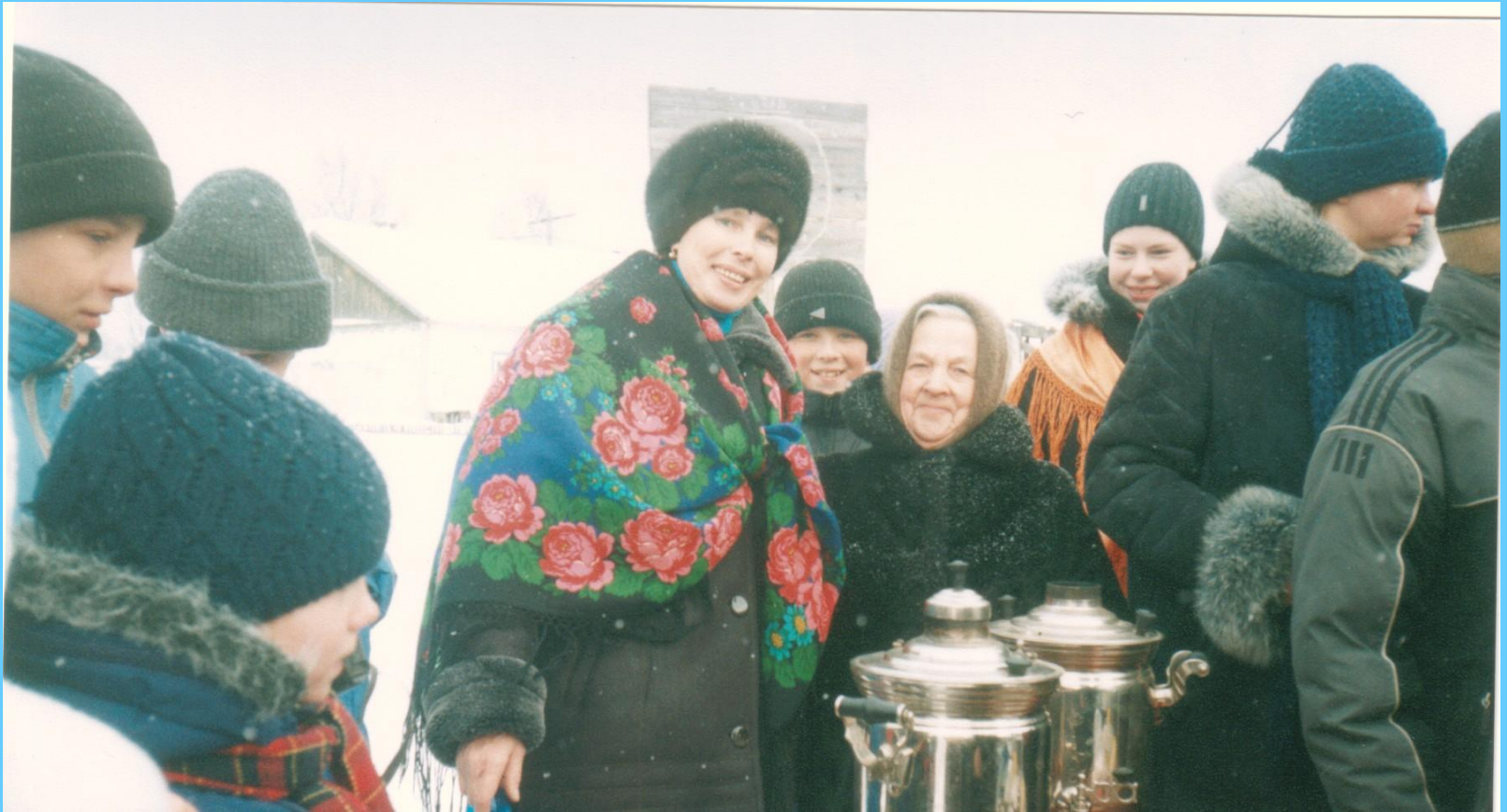
Празднование Масленицы в поселке Кубово.