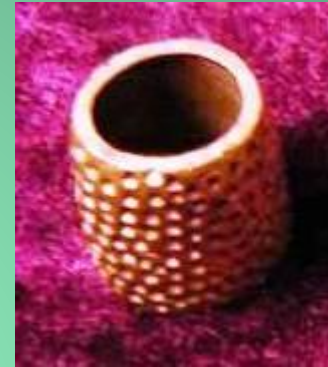
Наперсток изготовлен древним северным народом сихиртя, исчезнувшим вместе с мамонтами