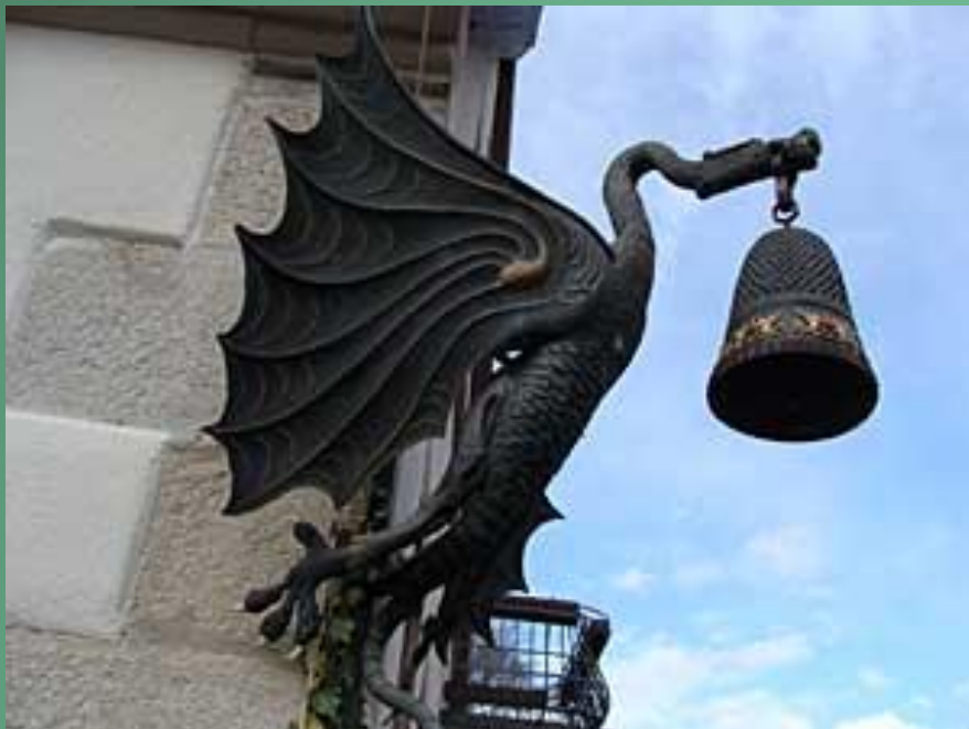
Музей наперстков в Германии