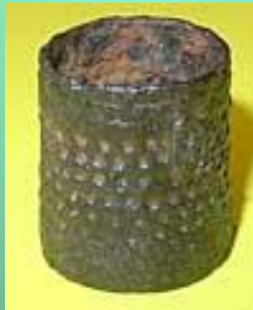
Железный финно-угорский наперсток