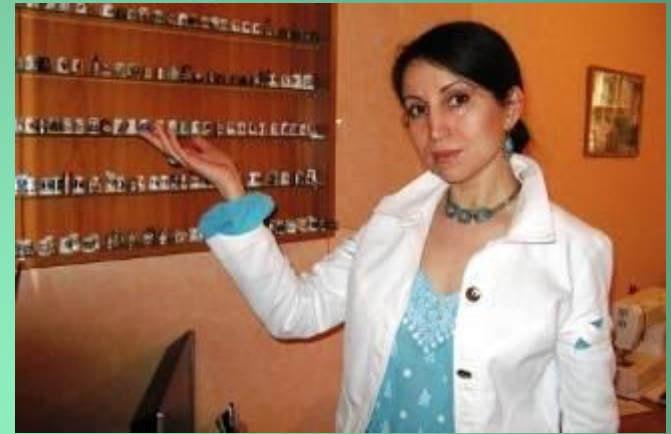
Одна из самых больших коллекций Украины