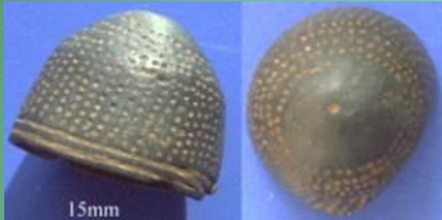
Наперсток найден на территории Германии примерно 1350 год