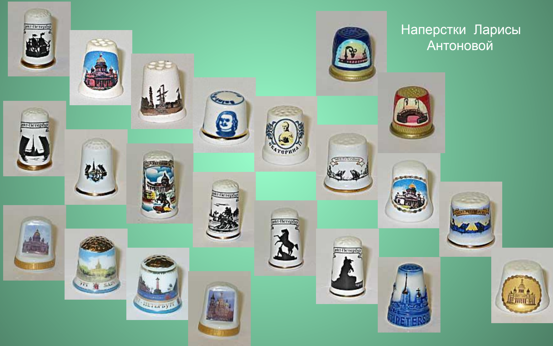
Наперстки Ларисы АНТОНОВОЙ