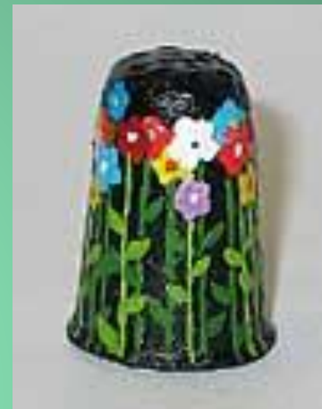
Наперсток из папье-маше