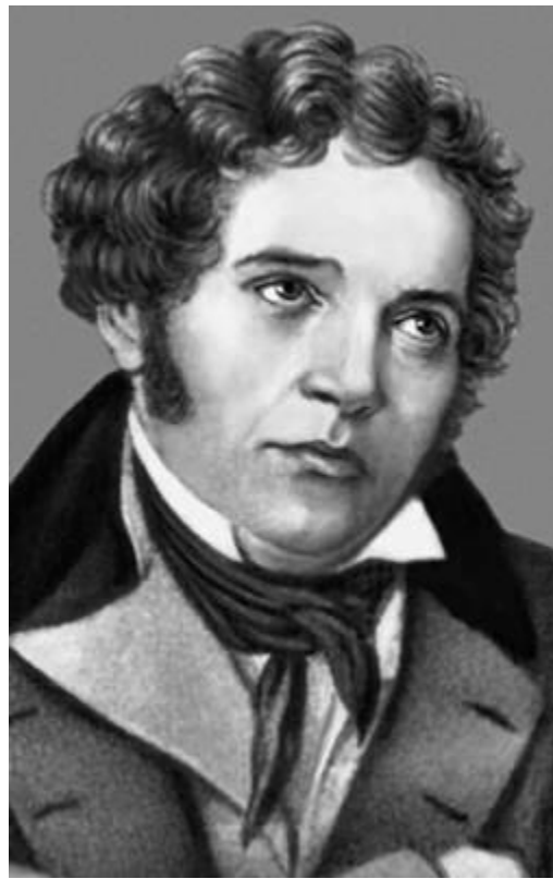
П. С. Мочалов в роли Мейнау («Ненависть к людям и раскаяние» А. Коцебу)