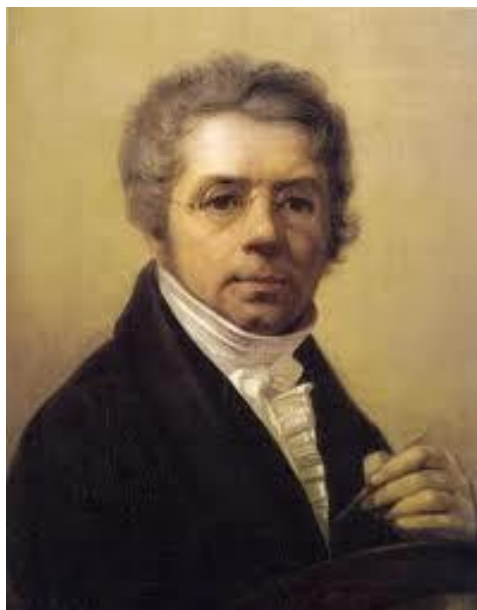
А.Г. Венецианов, автопортрет