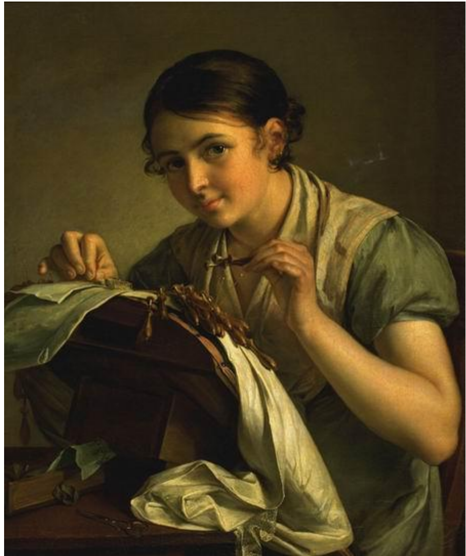
В.А. Тропинин, Кружевница