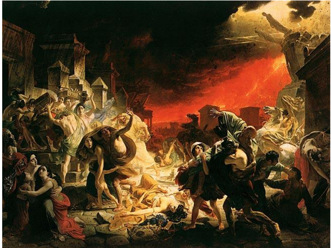
К.П. Брюллов «Последние дни Помпеи»