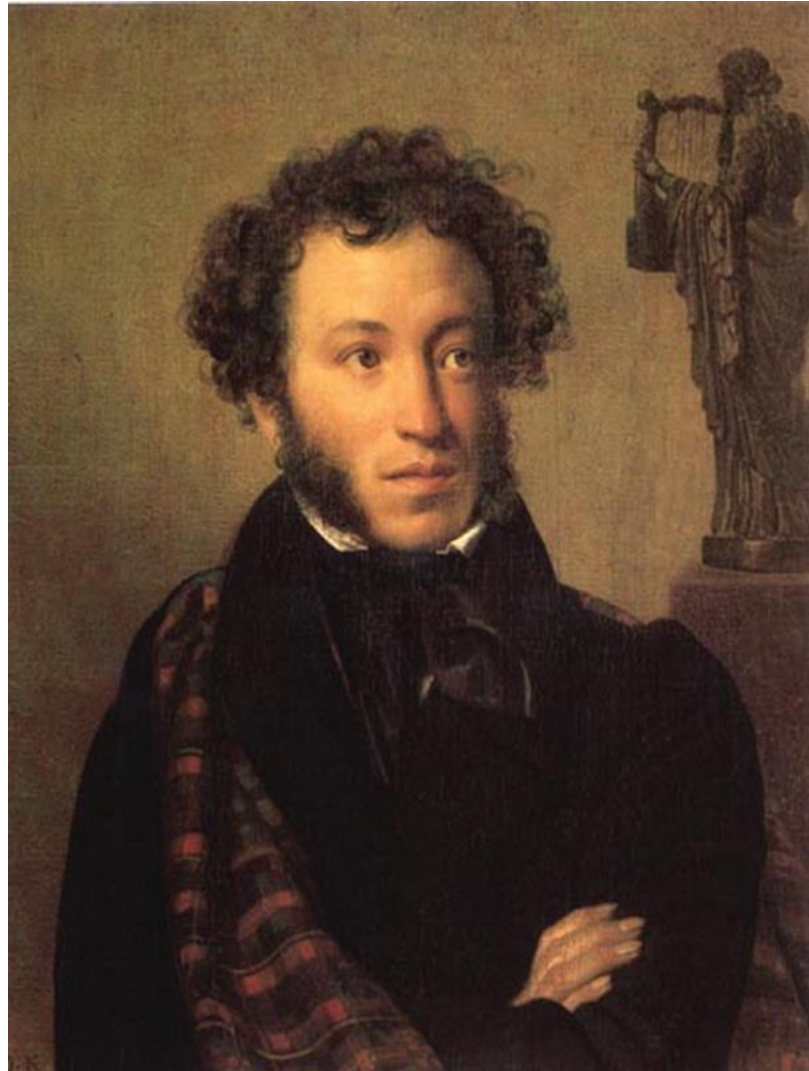
О.А.Кипренский портрет А.С. Пушкин