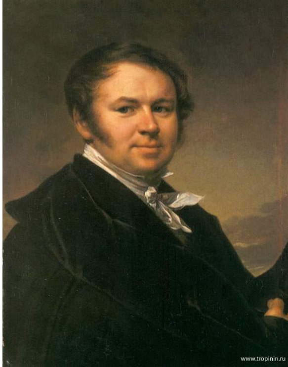
В.А. Тропинин, автопортрет