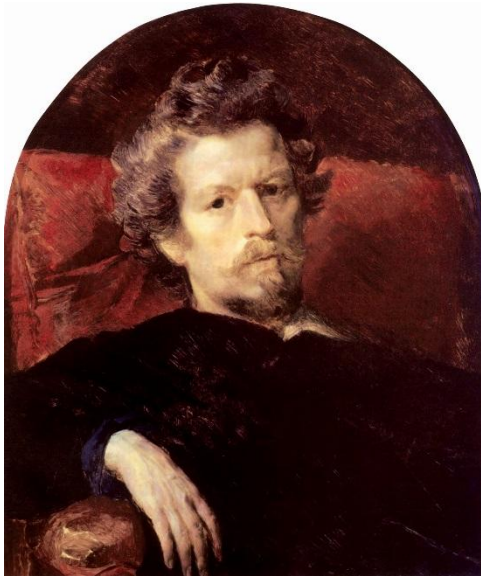
К.П. Брюллов, автопортрет