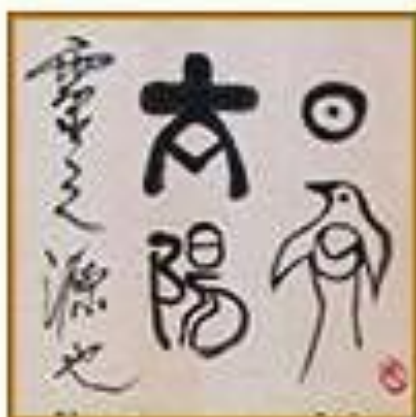
ЯПОНИЯ И КИТАЙ