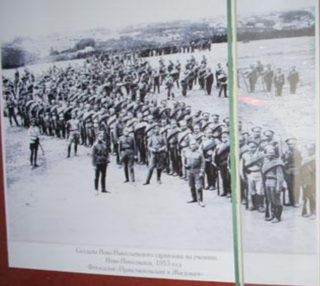
Солдаты Ново-Николаевского гарнизона на учениях Ново-Николаевск, 1917 год