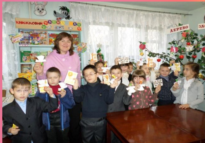
День Святого Миколая