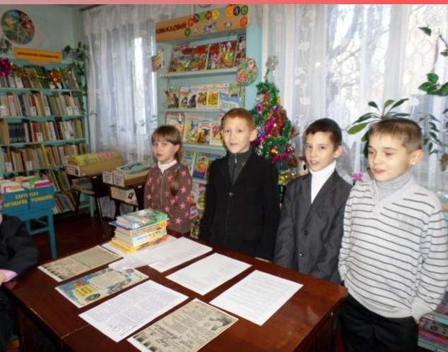
Новорічні щедрівки та колядки