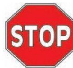
Стоп потрібно зупинитися і пропустити всі інші транспортні засоби

Дорожні знаки, що забороняють рух велосипедисту