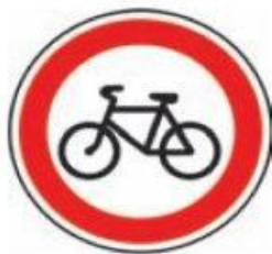
Рух на велосипеді заборонено

Дорожні знаки, що забороняють рух велосипедисту