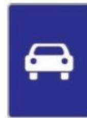
Дорога для автомобілів