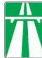
Автомагістраль рух на велосипеді заборонено