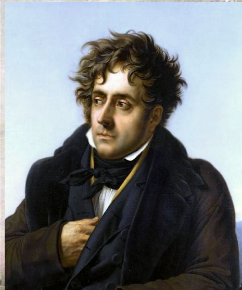
Рене де Шатобриан