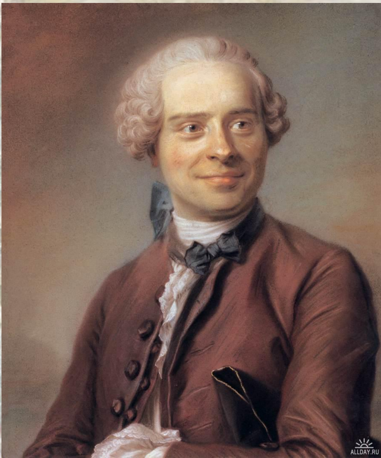
Жан Лерон Д'Аламбер