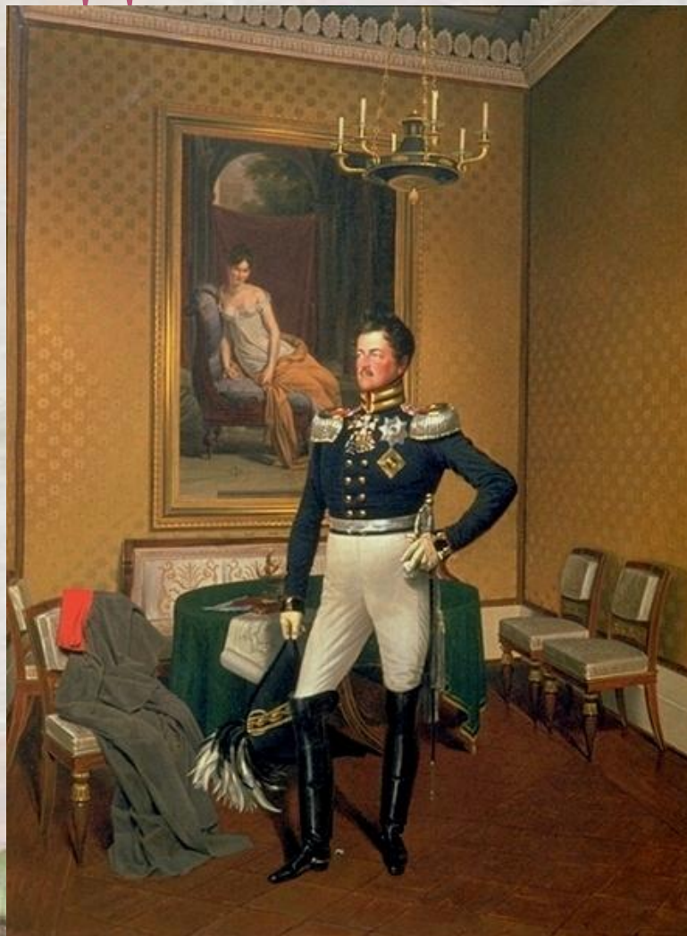
Принц Август Прусский