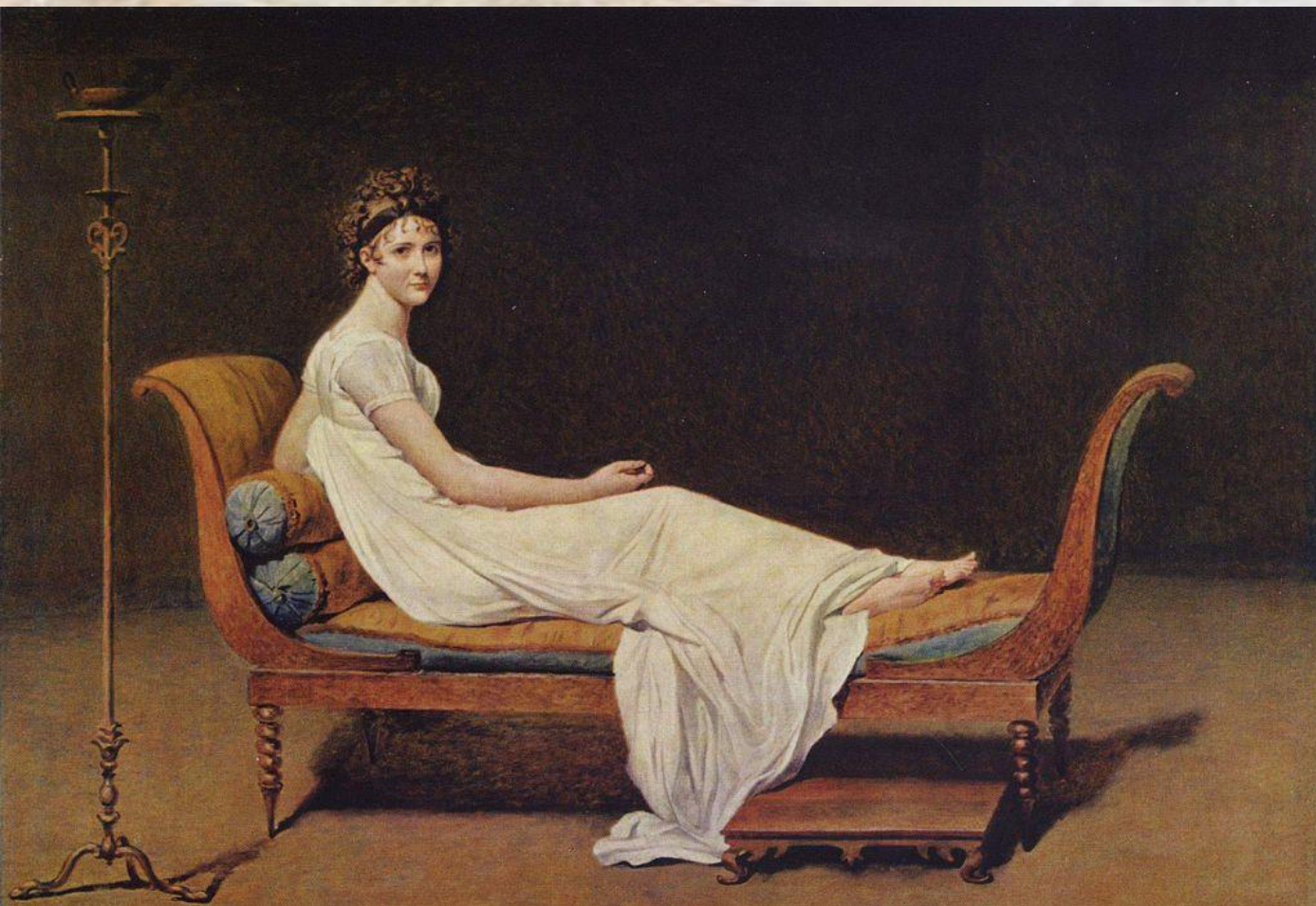
Жак Луи Давид, «Портрет мадам Рекамье», 1800.