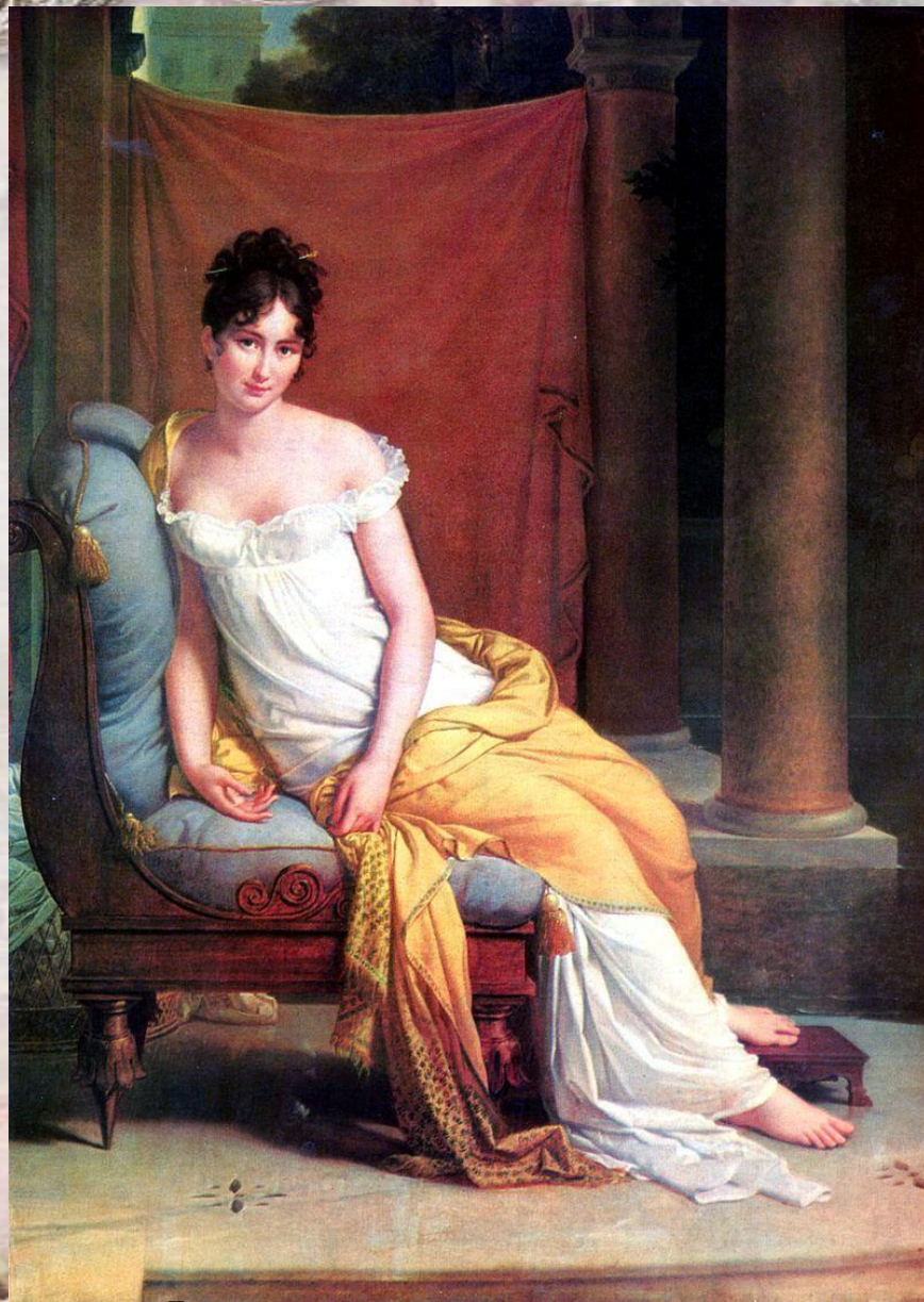
Франсуа Жерар, «Портрет мадам Рекамье», 1802.