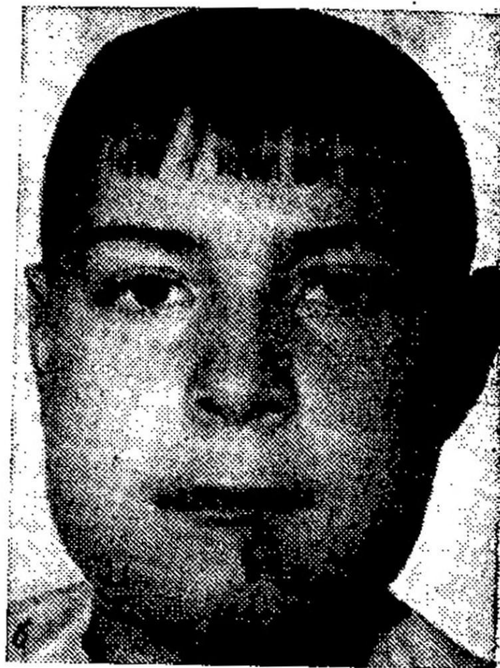
Рис. 61. Острый одонтогенный остеомиелит челюстей.

а — ребенок 8 лет, остеомиелит верхней челюсти, флегмона подглазничной области; б — мальчик 12 лет с диффузным остеомиелитом всех отделов нижней челюсти.