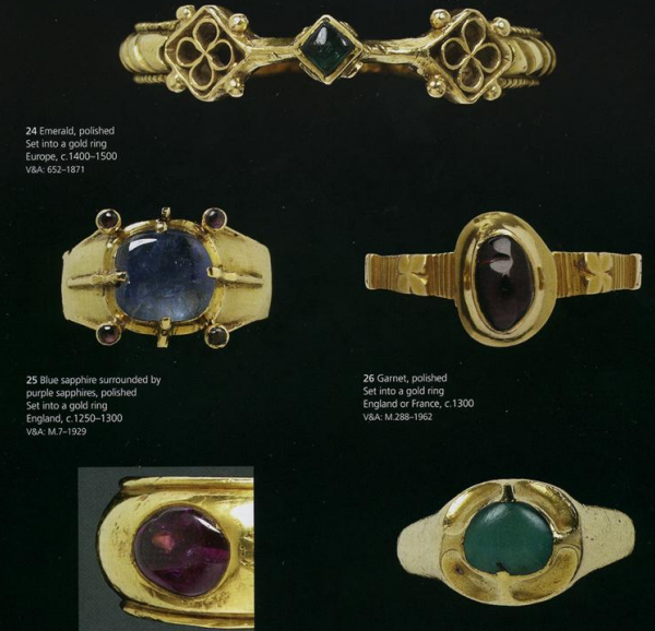
24 Emerald, polished Set into a gold ring Europe, c.1400-1500 V&A: 652-1871