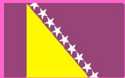
Босния и Герцеговина